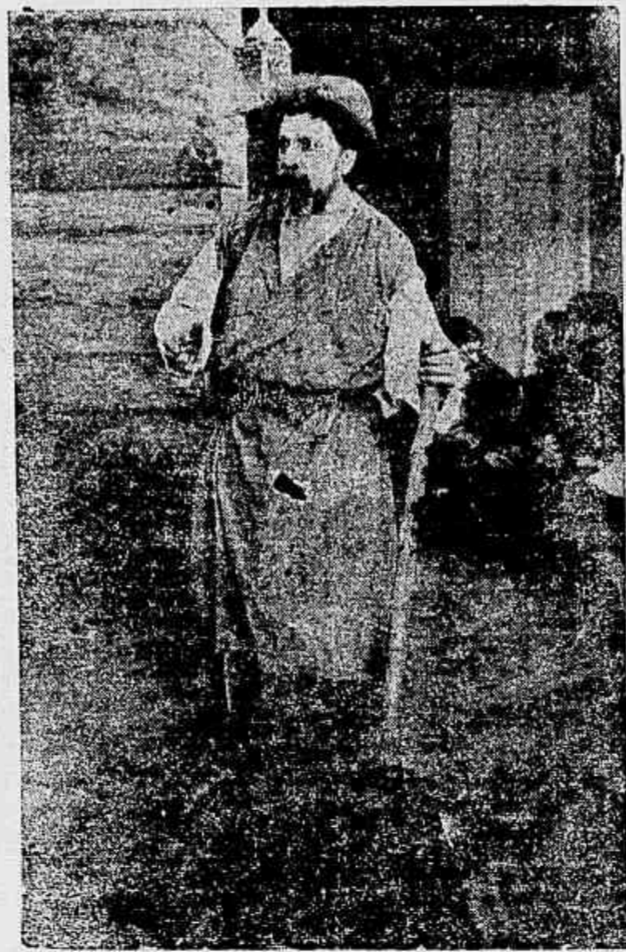
O cadaver vivo

Temos, agora, a philosophia de LEON TOLSTOI, o pujante escriptor russo, enalçada na tela cinematographica, em um film de grande belleza edifica, em sua forma, e apreciada fabrica italiana «Savoia».