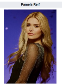
Pamela Reif (2020)