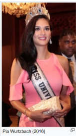
Pia Wurtzbach (2016)