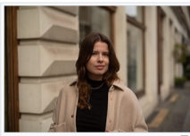
Luisa Neubauer, 2021

lerin und spätere Sprecherin von Fridays for Future in Deutschland.