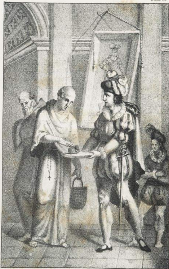
Il gentiluomo, portando un' pace sur un bacile d'argento, lo presenta al padre Cristoforo.