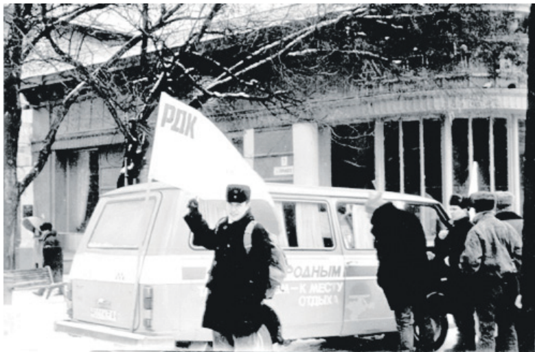
Активісти ДСУ біля агітаційного автобуса РДК («Республиканское движение Крыма»), що агітувало за повний вихід зі складу України. 90-ті роки

ських «двіженій», які сповідували й обстоювали лише свої егоїстичні вузьконаціональні шовіністичні цілі, українська громада Криму закликала кримське населення закласти міцний фундамент для вільного розвитку національних культур та освіти. Про важливість обговорюваних на конгресі проблем промовисто свідчили навіть назви головних доповідей, виголошених відомими кримськими науковцями та громадськими діячами: «Крим у загальноукраїнському та євро-