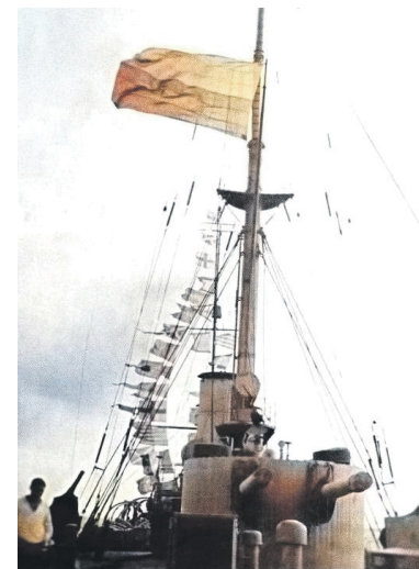
Прапор на крейсері «Пам'ять Меркурія», листопад 1917 р.

ній «Кагул», згодом «Гетьман Іван Мазепа») на знак протесту проти підняття українцями національного прапора списалося понад 200 росіян, замість яких корабель було укомплектовано українцями. «Пам'ять Меркурія» офіційно став першим українським крейсером сучасності.