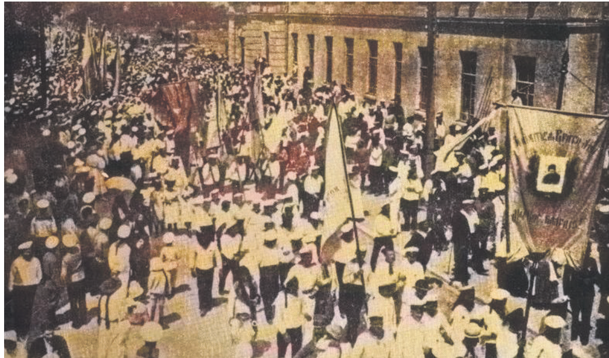
Маніфестація Української Чорноморської Громади у Севастополі, 1917 р.

на честь проголошення Української Народної Республіки провели маніфестацію, участь у якій узяли військовики та цивільне населення. До Севастополя по радіо надійшов текст III Універсалу Української Центральної Ради та наказ Чорноморському флоту від Генерального секретаря з військових справ УНР Симона Петлюри: «Провести церемоніал салютом на честь Української республіки».