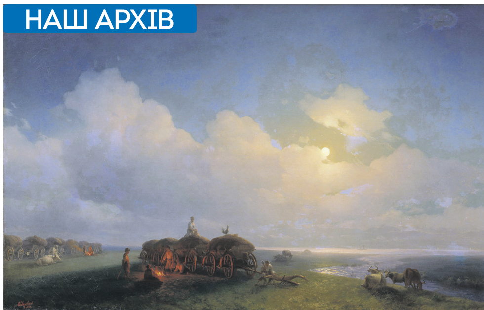
Айвазовський І. К. Чумаки на відпочинку. 1885

Безумовно, завдяки численним розвідкам, насамперед матеріалам з історії соляної справи на півдні України А. Скальковського, публікаціям І. Рудченка, Г. Данилевського, а в 20-х роках нашого століття записами з народних уст С. Терещенко, досить повно відображено звичаї та побут чумаків, їхній вічно мандрівний спосіб життя. Крім того, стараннями кількох поколінь науковців записано практично всі чумацькі пісні, що збереглися у пам'яті народній. Однак це лише історико-етнографічний пласт матеріалів, розкиданих по різних і не завжди приступних тепер виданнях. Зведеного ж корпусу тих публікацій не підготовлено й досі, як не упорядковано і окремого реєстру дослідників та майстрів художнього слова, котрі писали про чумаків. Тимчасом такий повний звід імен, гадається, дав би промовисту інформацію і, можливо, навіть визначив би нові напрями у дослідницьких пошуках. Особливо, коли б до нього потрапили не тільки українські, а й іншомовні автори. Адже, приміром, чумацькі пісні долучали до своїх збірок такі видатні польські збирачі фольклору, як Вацлав Залеський (1799-1849) та Оскар Кольберг (1814-1890). На жаль,