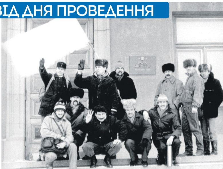
Активісти організації «Державна самостійність України» у Сімферополі біля Ради міністрів АР Крим, 90-ті роки

На відміну від галасливих шовіністичних збіговиськ усіяких «руських общин» та сепаратист-