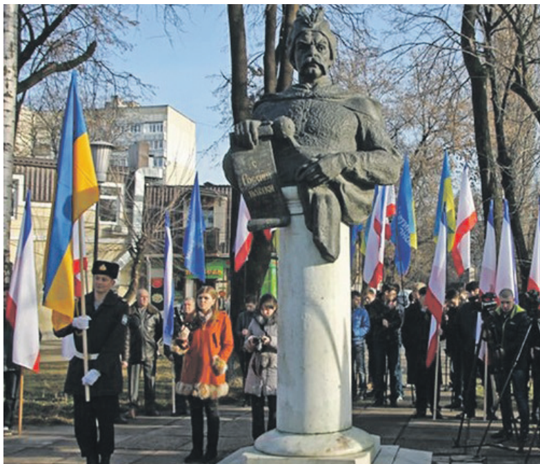
Січень 2014 р.

Створюється нехитра піар-конструкція "діти лейтенанта Шмідта", відома з часів Ільфа та Петрова. Під це лекало цілком підходить і створене паном Грачем об'єднання "НБХ", яке зарезервувало собі право на розпорядження цілою Україною, як і Великий гетьман Богдан», – писав автор. – Мета руху "спадкоємців" – повторення процедури приєднання України до Росії "за Хмельницьким"».