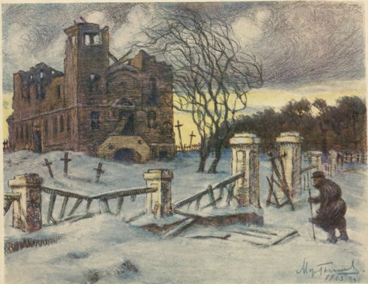
Польскій костель въ Сувальской губ. послѣ ухода нѣмцевъ.