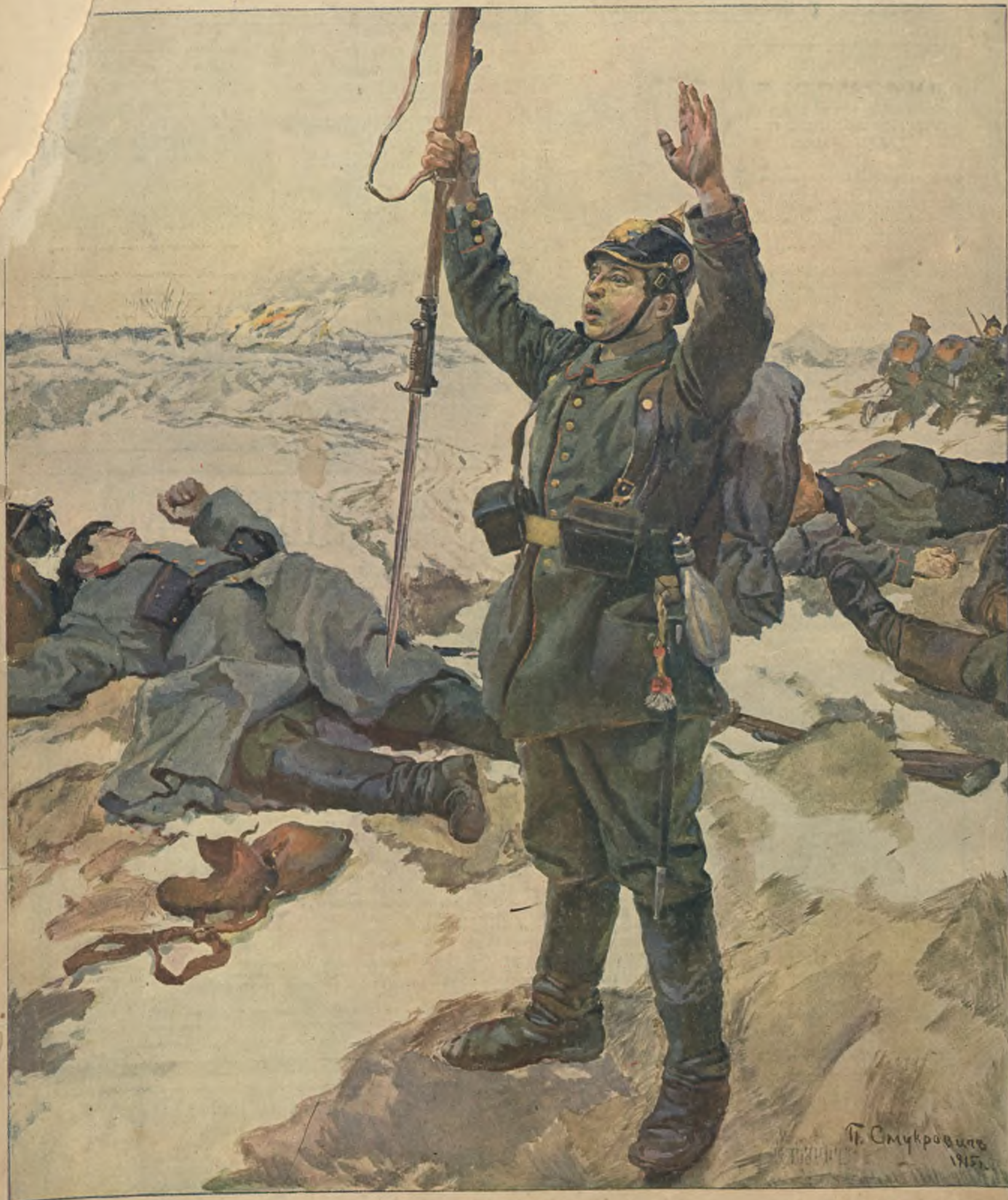
Сдача въ пѣль.