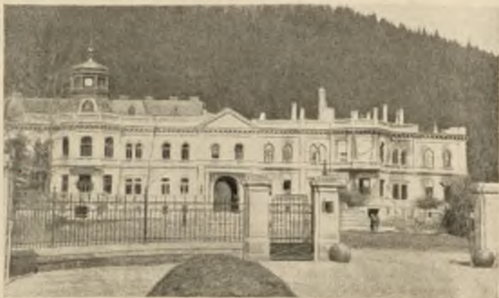
Подъ Сколемъ. Замокъ барона Гределя, друга Франца-Иосифа. Половина крыши замка снесена нашимъ снарядамъ.