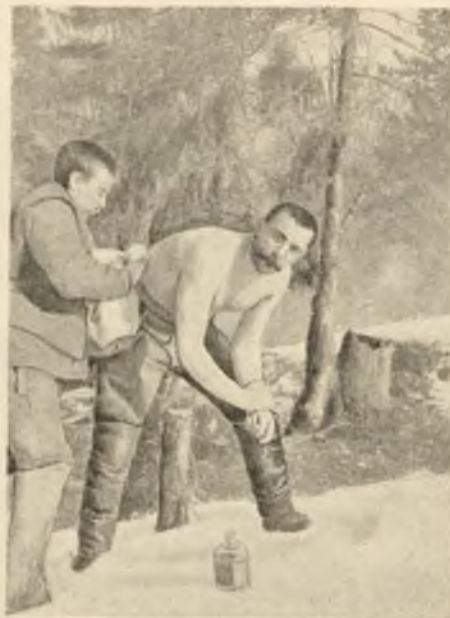
Утренний туалет на высоте 1175 м. въ Нарпатахъ.