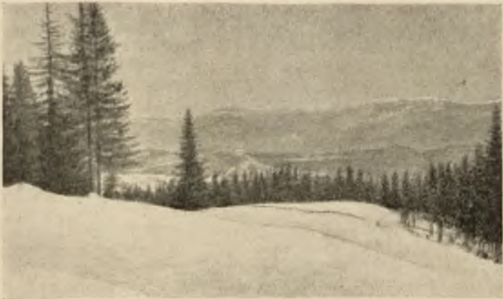
Козювка. На переднемъ планѣ наши окопы, вдали на горахъ—австрійскіе.