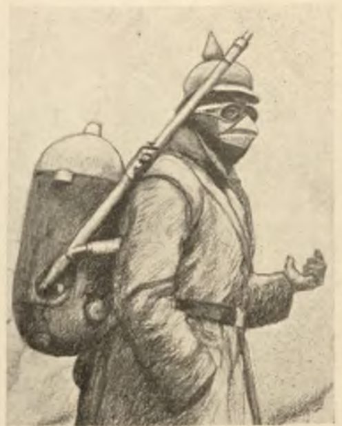
Германецъ съ аппаратомъ удушливыхъ газовъ.