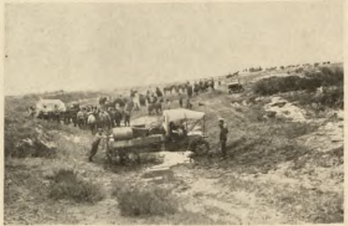
Дорога на Хой.

нѣкоторый военный опытъ. Всякіе виды видывалъ. А вотъ—не пойму. Какъ это можно воевать безъ всякой военной чести, безъ тѣни благородства? И особенно это неприятно, знаете, когда вспомнишь, напримеръ, тѣхъ же японцевъ. Тѣ были—воины, настоящіе воины, и война была для нихъ—святое и честное дѣло. И насъ они уважали, а нашимъ героямъ отдавали такія же воинскія почести, какъ и своимъ собственнымъ. А это—развѣ войны? Это—хамы ряженые. У нихъ просто никакого различія между благородствомъ и подлостью нѣтъ. Органически нѣтъ. Какое-то пустое мѣсто въ груди. И, конечно, мы ихъ побьемъ. Нельзя не побить, потому что просто передъ Богомъ мы обязаны очистить землю отъ этого смрада. Но, вы знаете, неприятно. Иногда—словно не война, а ассенизація кака-то.