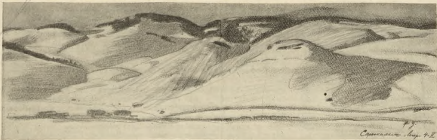
Сарынамышъ. Высоты въ сторону Бардусскаго перевала, съ которыхъ турки вели наступленіе, налѣво — вокзалъ, направо — «Орлиное гнѣздо».

лей, но всегда говорить—лучше по-русски... Вѣдь ты живешь въ Россіи, вѣдь ты моя!.. моя!..—