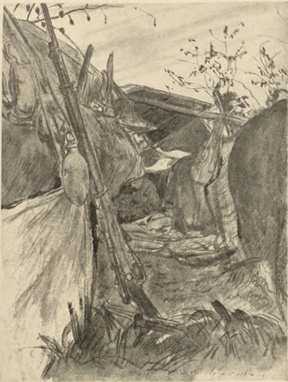
Въ онопѣ. Архаве за Хопой.