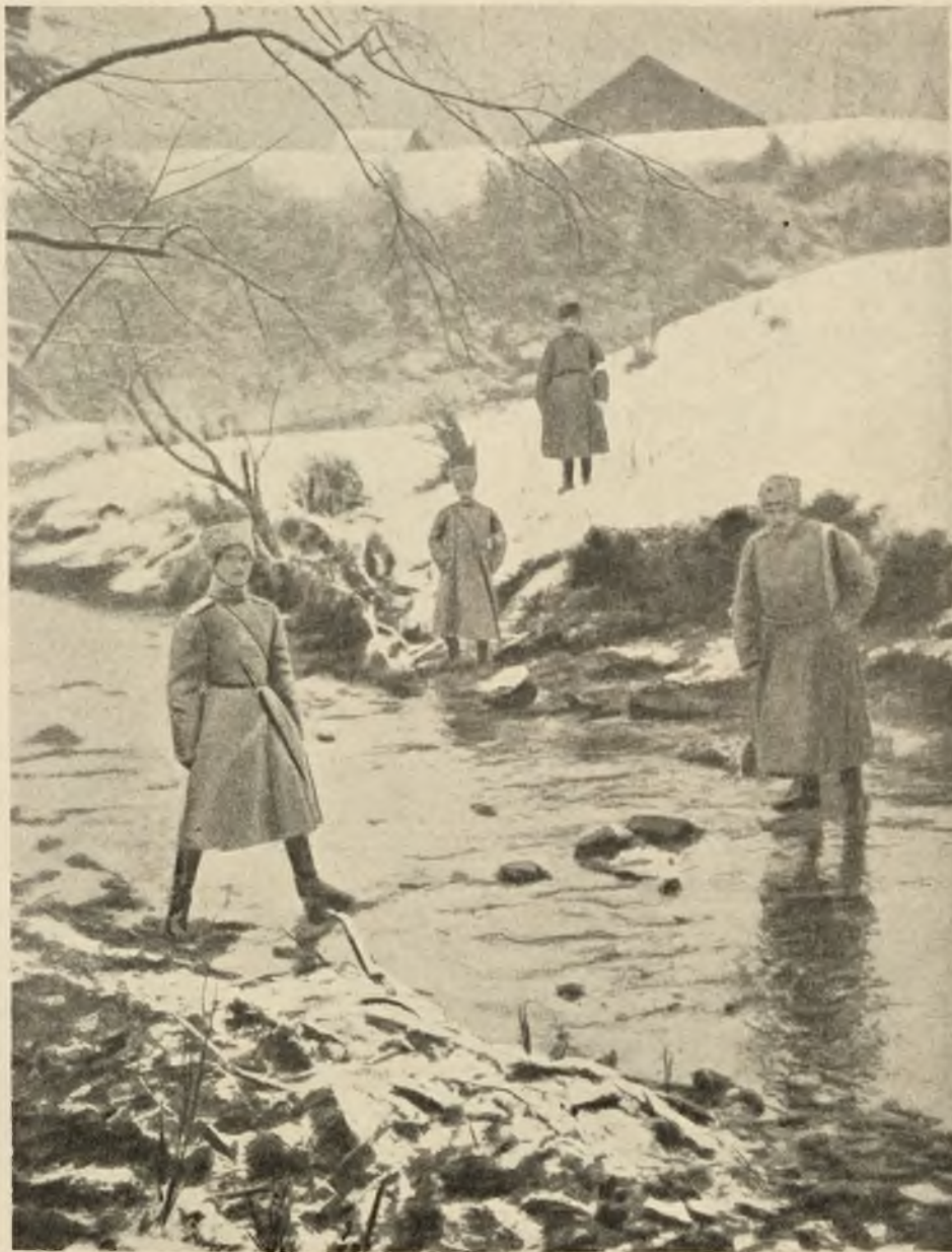
Великій Нязь Михаилъ Александровичъ на Нарпатахъ.