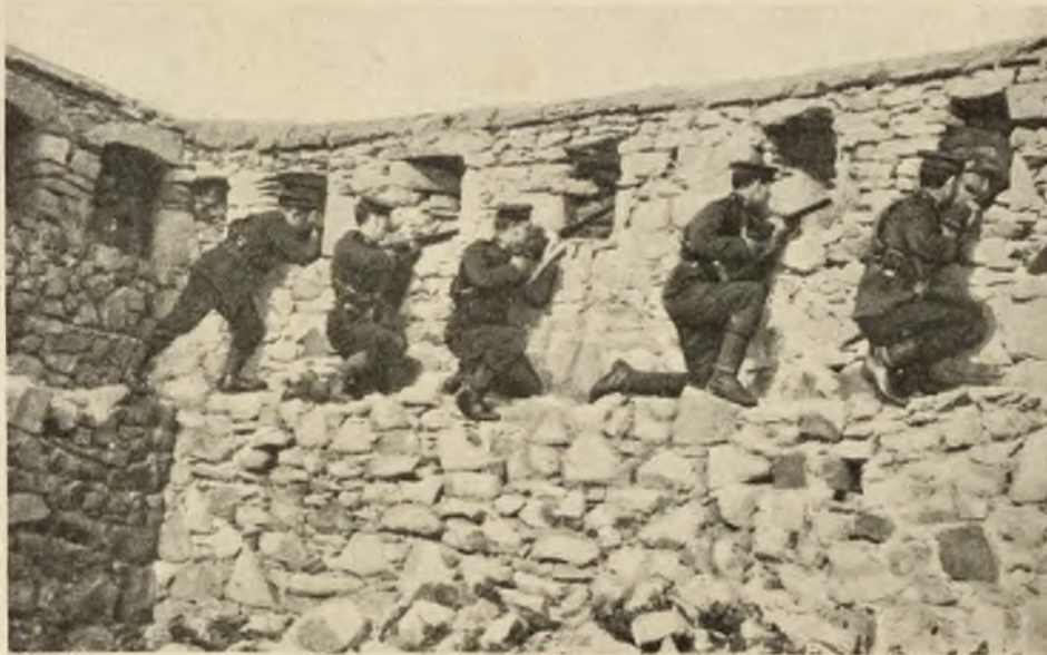
Британскій десантный отрядъ обстрѣливаетъ турокъ изъ-за развалинъ взорваннаго форта.