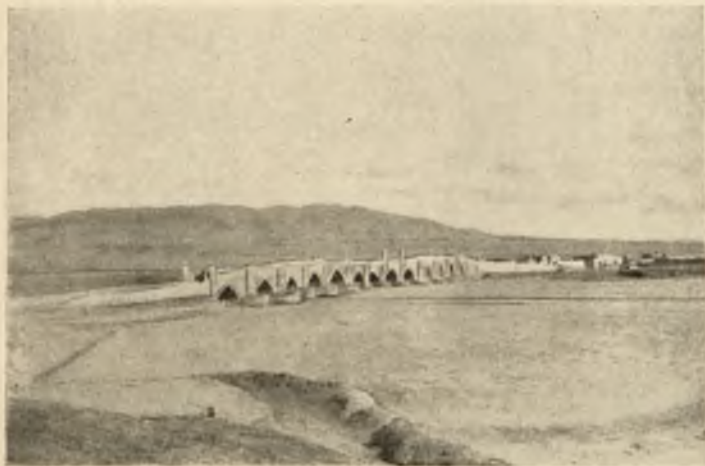
Мостъ передъ Тавризомъ.