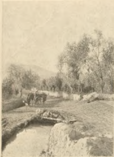
Дорога на Хой, по которой недавно велось наше наступление.