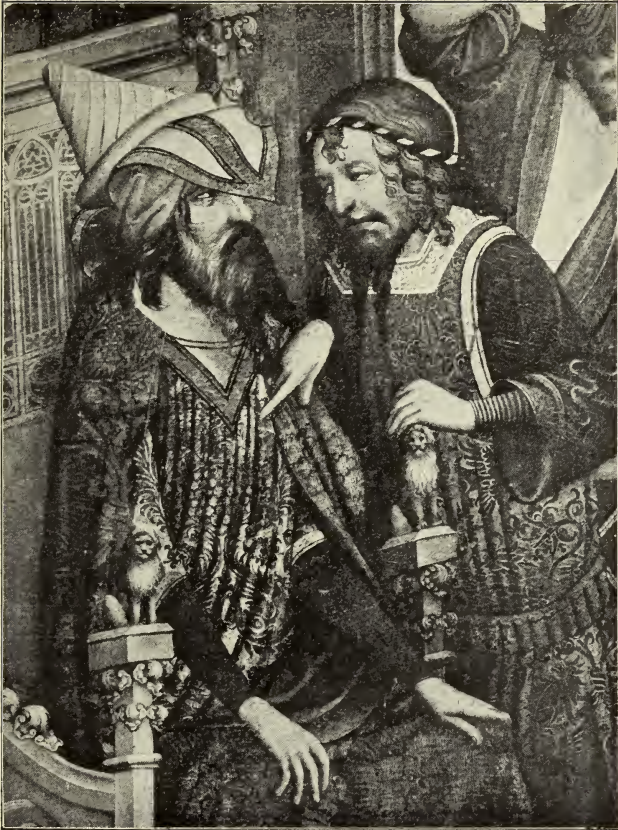
PILATUS UND KAIPHAS AUS DER GEISSELUNG