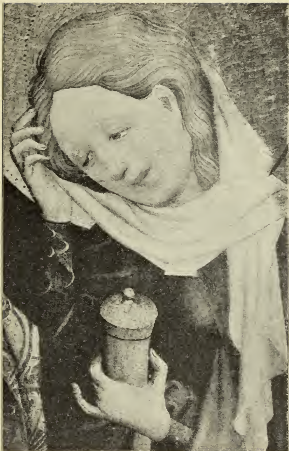
MARIA MAGDALENA AUS DER GRABLEGUNG