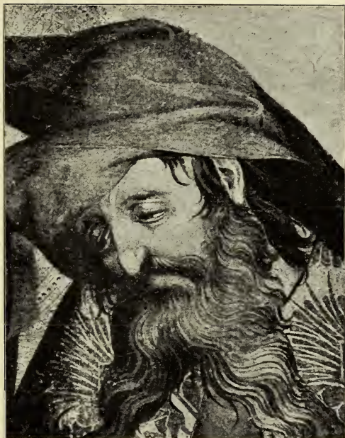
JOSEPH VON ARIMATHIA AUS DER GRABLEGUNG