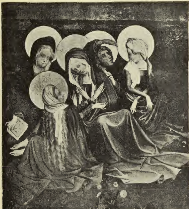
DIE FRAUEN UNTER DEM KREUZ

die Linke auf die Schulter der Madonna gelegt. Auf diesem Hauptbilde sind die Formen sorgfältiger durchgebildet als auf den meisten Flügelbildern. Am deutlichsten ist es an den Händen