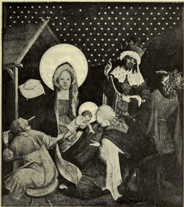
DIE ANBETUNG DER KÖNIGE

schützend über die Augen. Sehr naiv ist der Stern von Bethlehem aus der Masse der gleichartigen, goldenen Sterne herausgehoben, die den roten Grund bedecken. Er scheint durch eine schwarze