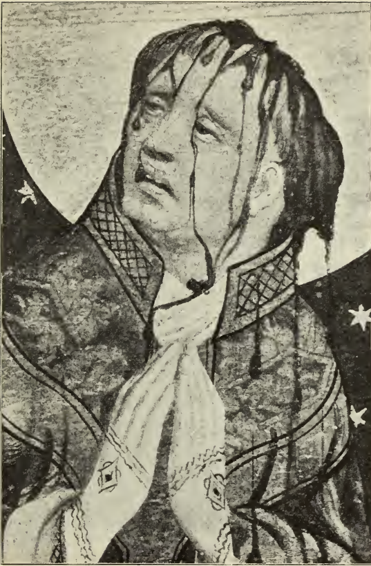
ST. THOMAS VON CANTERBURY AUS DEM MARTYRIUM