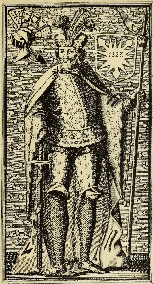
IDEALBILDNISSE ADOLFS VON SCHAUENBURG Nach Staphorst 1725