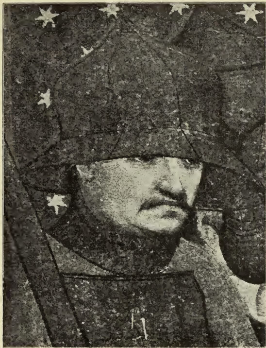
KOPF EINES RITTERS AUS DEM MARTYRIUM DES HEILIGEN THOMAS