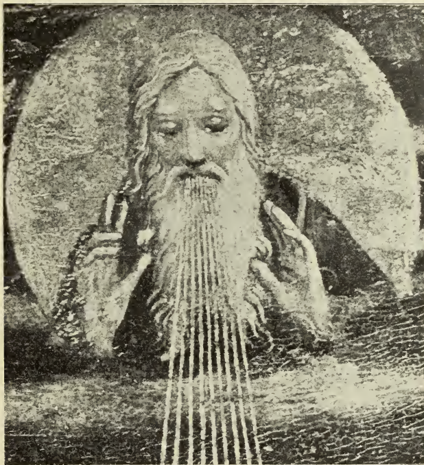
GOTT VATER AUS DER GEBURT CHRISTI