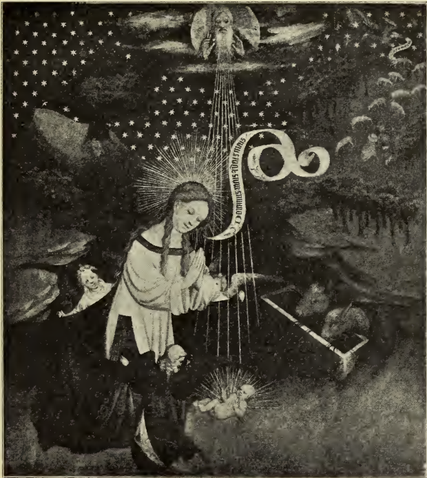
DIE GEBURT CHRISTI

und erloschenem Purpur gesäumt, beherrscht den farbigen Aufbau. Auf die für Meister Franckes Entwicklungsstufe ungemein vollen und kräftigen Formen des Kindes hat schon Waagen hingewiesen.