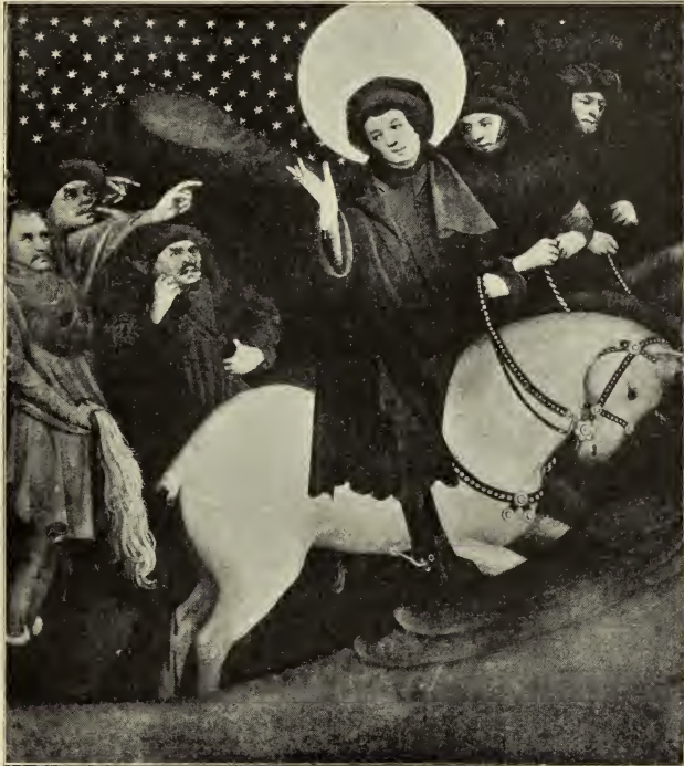
DIE FLUCHT DES HEILIGEN THOMAS

Sein Begleiter auf isabellfarbenem Pferd trägt Schwarz, der folgende, auf einem Grauschimmel, eine Art von dunklem Russischgrün. Die Ecke mit den Köpfen gegen die grünen Bäume, durch die