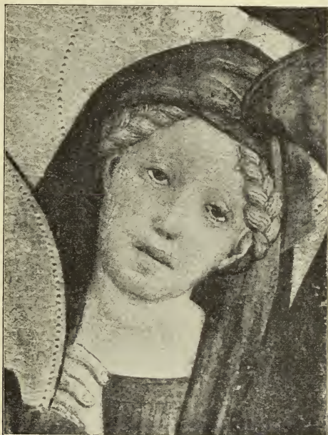
MARIA CLEOPHAS AUS DER GRABLEGUNG

die graue Wand des Hauses stösst. Hier fühlt man deutlich, wie er sich bemüht, Licht und Luft zu bezwingen. Ein Seitenstück bildet die Partie rechts unten auf der Kreuzschleppung, wo sich ein entwickelteres Raumgefühl ausspricht in der Art, wie die Beine der Schergen sich vom Hintergrund lösen.