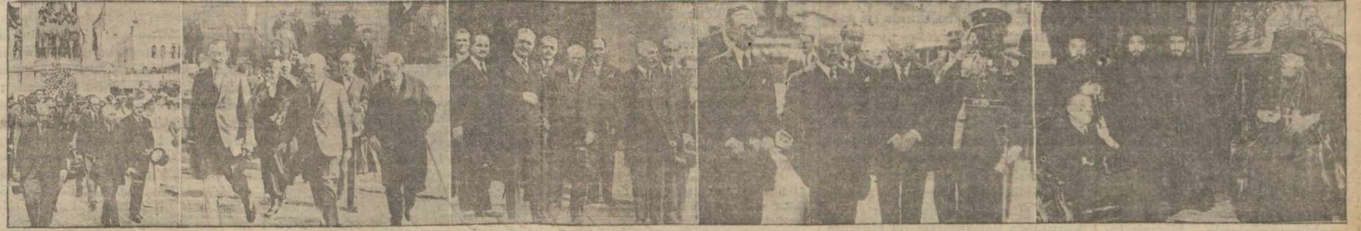
M. Çaldaris Haydarpaşa'da müstakbilin arasında, dost Başvekil vilâyet konağında çıkıyor, Cumhuriyet abidesi önünde Yunan Başvekil ve nazırları, Yunan Başvekil ortodoks patriği Ef. ile konuşuyor.

Acaba Rusya'nın Avrupaya dönüşü, beynelmil müvazene üzerinde nasıl bir ağırlık teşkil edecektir? Evvelâ şunu itiraf etmek lâzımdır ki henüz Avrupada mütebellir bir müvazene yoktur. Fakat altmış senelik Almanya Fransa rekabeti eskisi gibi devam ediyor. Bu iki devlet arasındaki münasebet Avrupa siyasetinin en ehemmiyetli düğüm noktalarından biri olduğuna göre Rusya'nın faal bir şekilde Avrupa konserine avdeti bu münasebetler üzerinde nasıl bir tesir yapacak? Hitler iktidara geçmeden evvel, Rusya'nın Fransa ve Almanya siyasetlerinden hangisini tercih edeceği şüpheli idi. Hatta denilebilir ki Almanya müteveccih idi. Bugün vaziyetini tamamilen aksi olduğu iddia edilebilir. Hitler tarafından takip edilen siyaset, Sovyet Rusya'yı Almanyadan uzaklaştırmıştır. Ve Rusyadan uzaklaştıkça da Fransaya yaklaşmıştır. Son günlerde Rusya ile Fransa arasındaki mukararî netice hızla iki ziyarete yapılmıştır. Biri Herriot'un, diğeri de Fransız Hava Nazırı M. Pierre Cot nun ziyaretleri. Gerçi Herriot bu aralık kabineye dahil değildir. Fakat ekseriyet fransızın lideri ve Hariciye Encümeninin teklifiyle Fransada çok ehemmiyetli bir mevkii