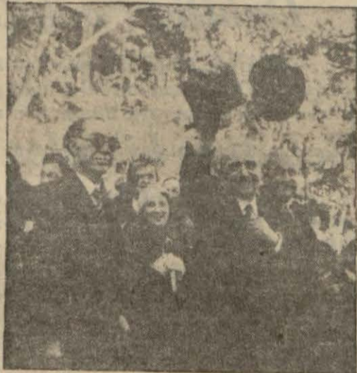
Başvekil İsmet Paşa Hazretleri M. Çaldaris'i uğurluyor.