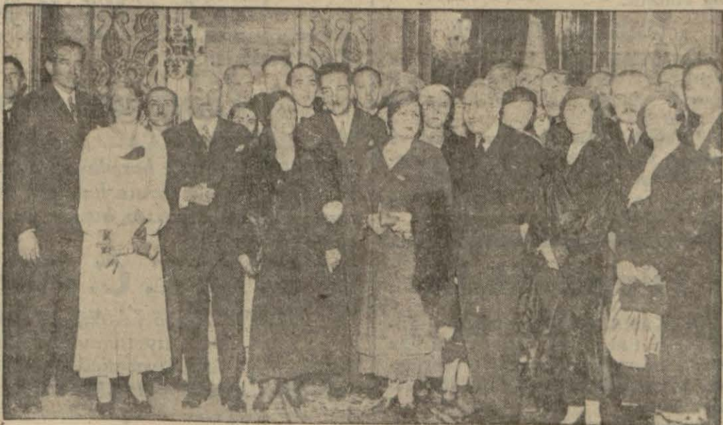
Yunanlı misafirlerimiz Beylerbeyi sarayında..

Dün sabah Beyoğlu, muhterem misafirlerin serçine Türk ve Yunan bayraklarıyla süslenmişti. M. Çaldaris ve