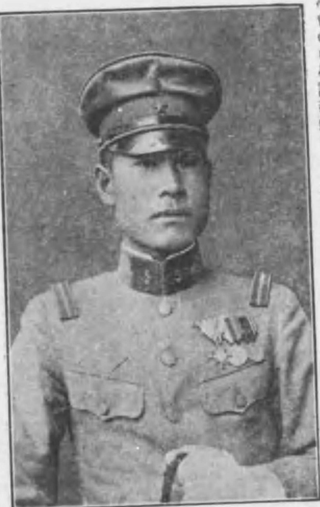
昭和七年四月五日滿洲派遣編成下令、同月十三日青

夫を遣せり。政吉明治三十二年三月二十四日の生にして、明治四十二年三月島守尋常高等小學校世増分教場に於て尋常科を卒業し、次で一戸郡中澤村農業補習學校に入校、明治四十五年三月同校卒業、爾後家事農業に従ひ其傍ら大日本國民中學會の中學講義録により孜々勉強して倦むことなく大に進歩する所あり。又青年團に入りて精勵し、模範青年として克く後輩を指導せり。大正八年十二月徵兵として青森歩兵第五聯隊に入營し、第十一中隊に編入せらる。爾後軍務に精勵し成績優秀を以て下士官候補として特別教育を受け、同十年十二月歩兵伍長に任ぜられ、大正十一年四月青森出發浦鹽に出征し、同年十月凱旋し、同年十一月果進して軍曹に任ぜられ、後曹長、特務曹長を経て昭和三年十二月少尉候補として陸軍士官學校に入校、翌四年十一月同校を卒業、昭和五年三月陸軍歩兵少尉に任ぜらる。