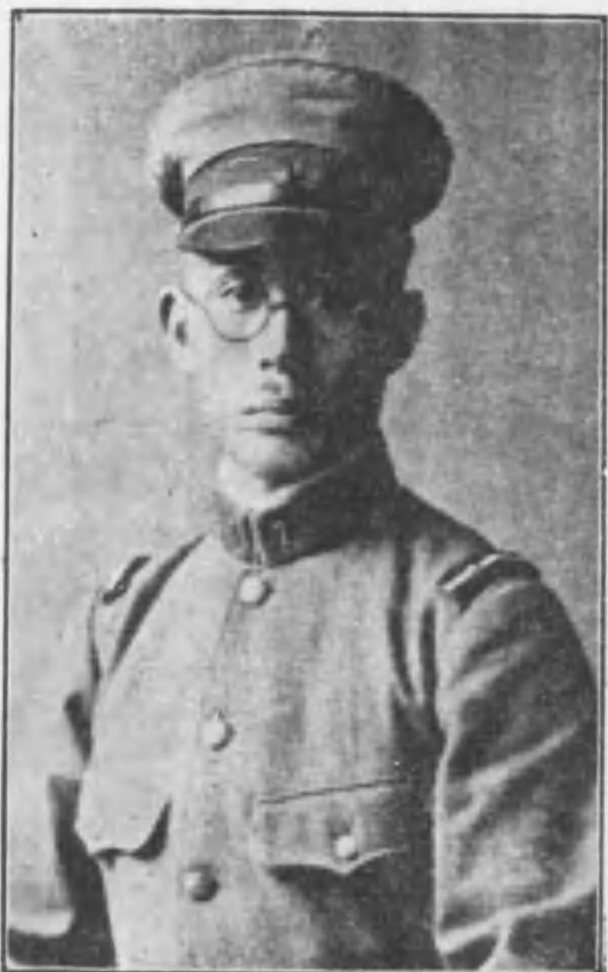
砲兵曹長に任ぜられ、後左の恩賞あり。

同八年二月十五日以降は熱河作戦に入り、其の後三月八日に至る間に於て冷口より喜峰口に至る間大行李の監視に任じ刻苦精勵にして任務を完うし、諸隊の給養に支障なからしめ其功績を認められたり。三月九日以後は臨時山砲兵中隊に配屬せられ、大行李監視長として三家子附近の戦闘に参加し、爾後同地附近の警備中輕機關銃を指揮し、中隊の右側を警戒