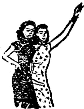
活 生 年 青