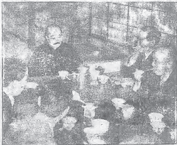
席地而坐口嚼東洋菜的周作人氏（圖中穿黑袍的）

他們先到日本的關西，關西人用什麼來「歡迎」他們呢？用女人大腿！ 話說他們到神戶那