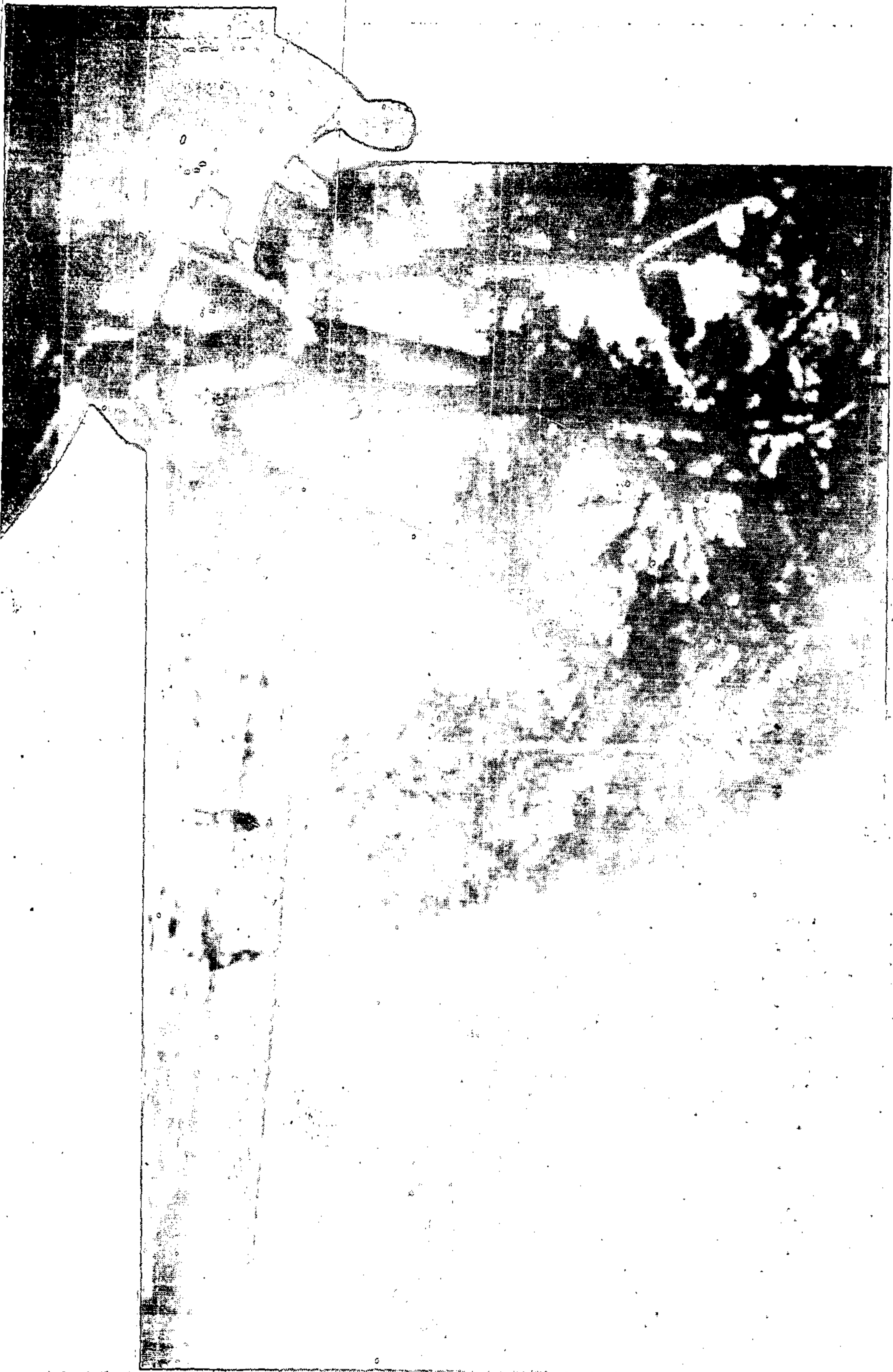
景風山鳳凰省天奉