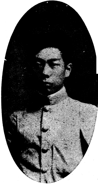
二十四歲攝於東京