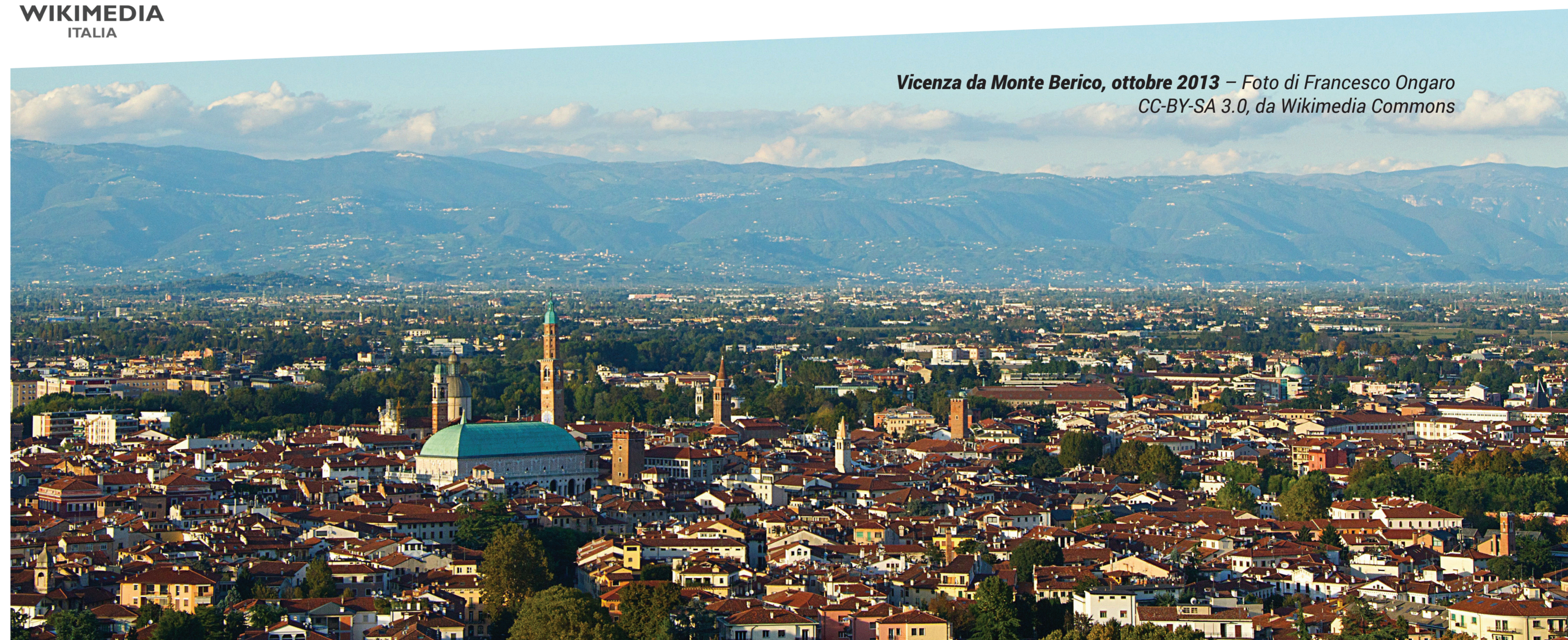
Vicenza da Monte Berico, ottobre 2013

festAmbiente VICENZA un mondo migliore è possibile... aiutaci a costruirlo