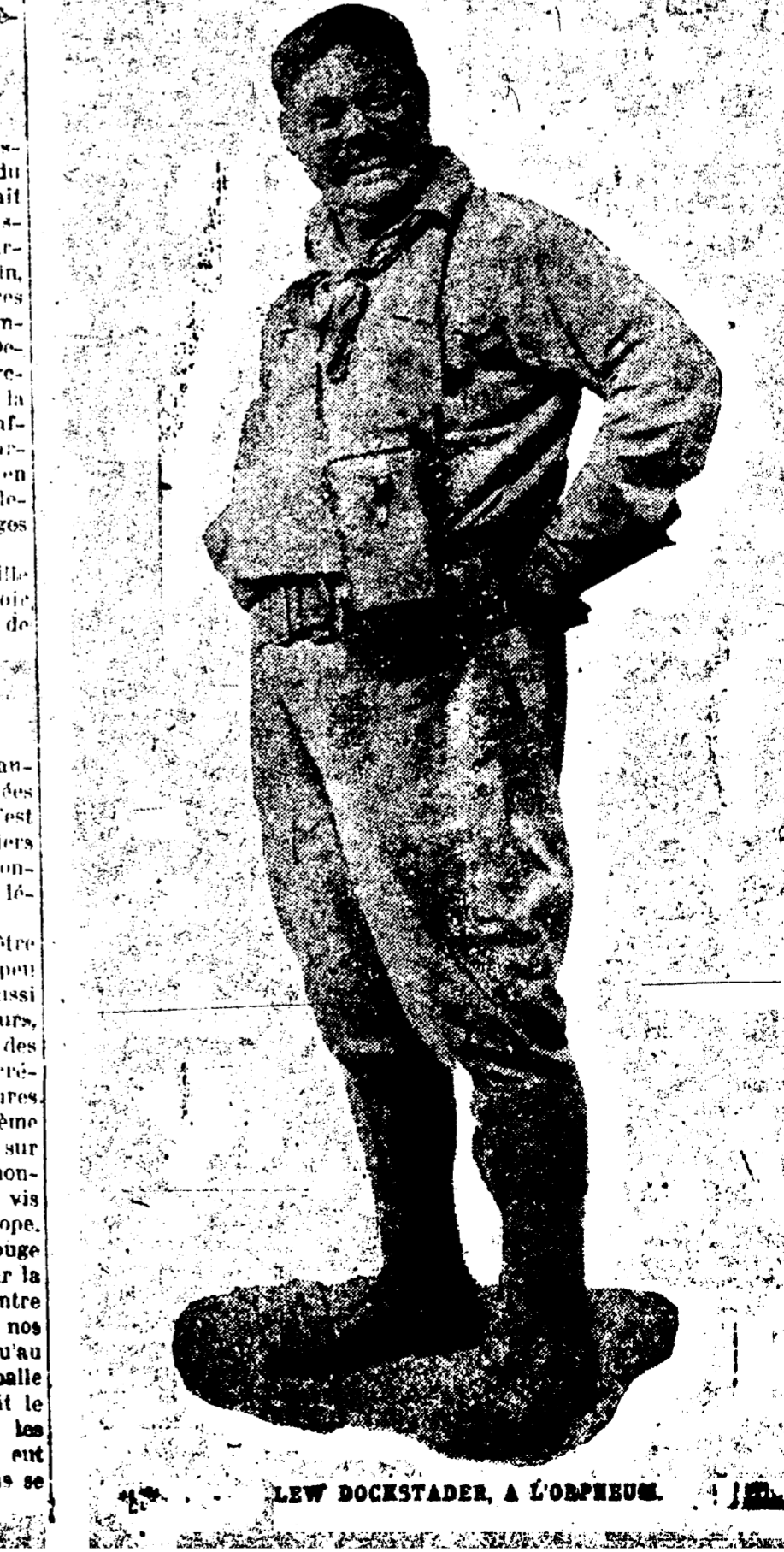
LEW DOCKSTADER, A L'ORPHEUM.

L'ABEILLE de la Nouvelle-Orléans sert des abonnements au prix de 65 sous par mois, de nos bureaux, ou 15 sous par semaine pris au porteur. ETES-VOUS ABONNE?