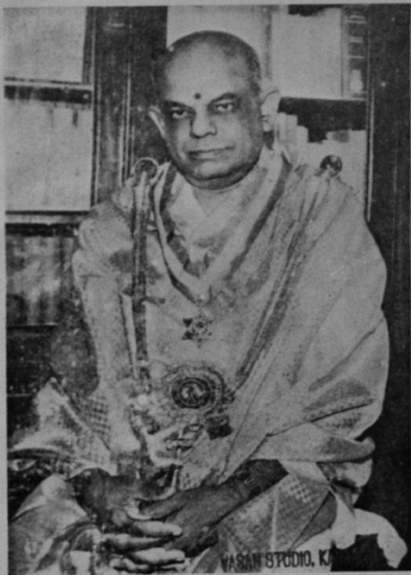
தமிழ்க்கடல் சிவமணி ராய. சொ.