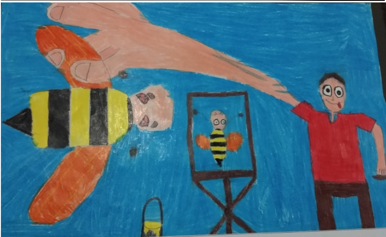
HISTÓRIA DA ABELHA