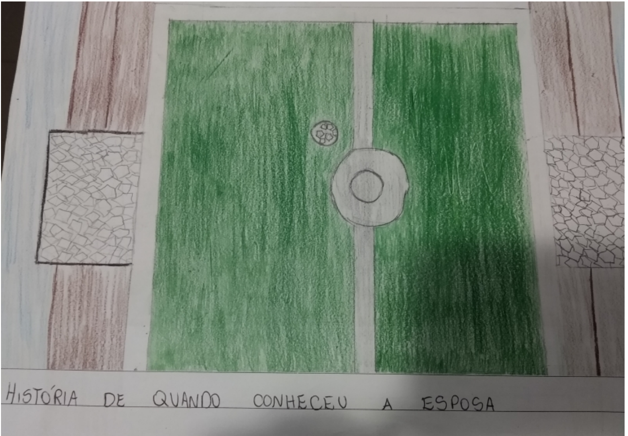
HISTÓRIA DE QUANDO CONHECEU A ESPOSA