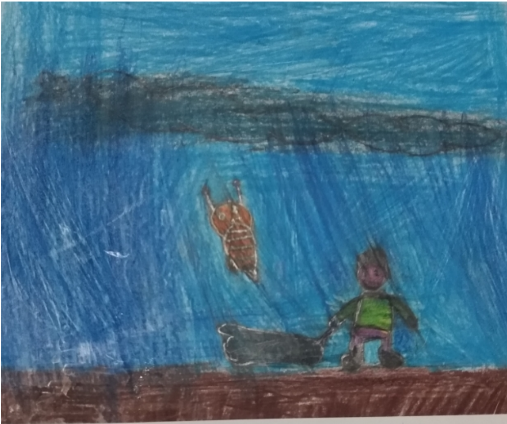
HISTÓRIA DA ABELHA