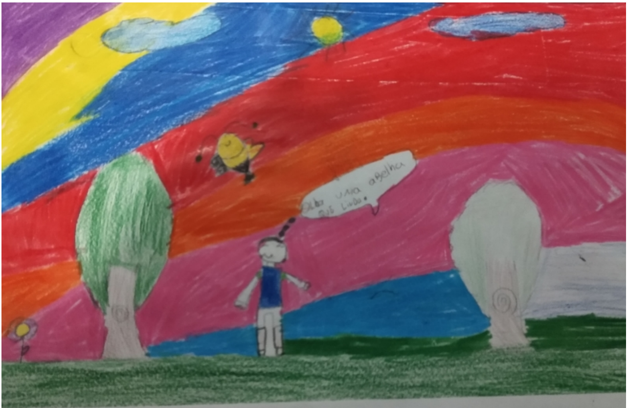
HISTÓRIA DA ABELHA