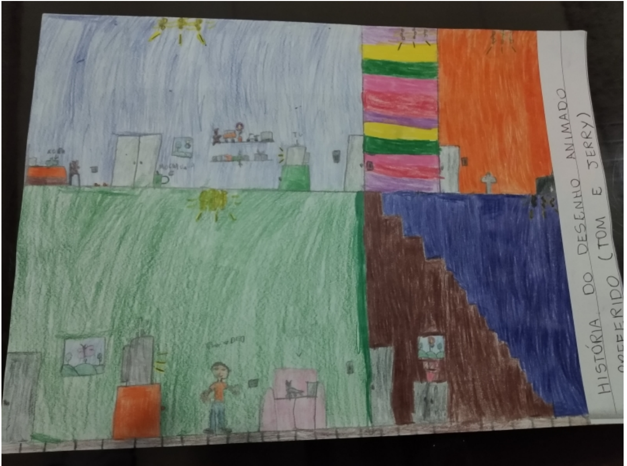
HISTÓRIA DO DESENHO ANIMADO OPERADO (TOM E JERRY)