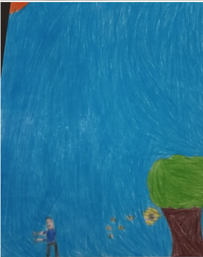
HISTÓRIA DA ABELHA