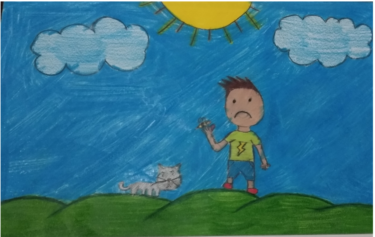
HISTÓRIA DA ABELHA