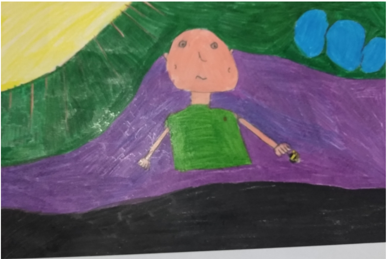
HISTÓRIA DA ABELHA