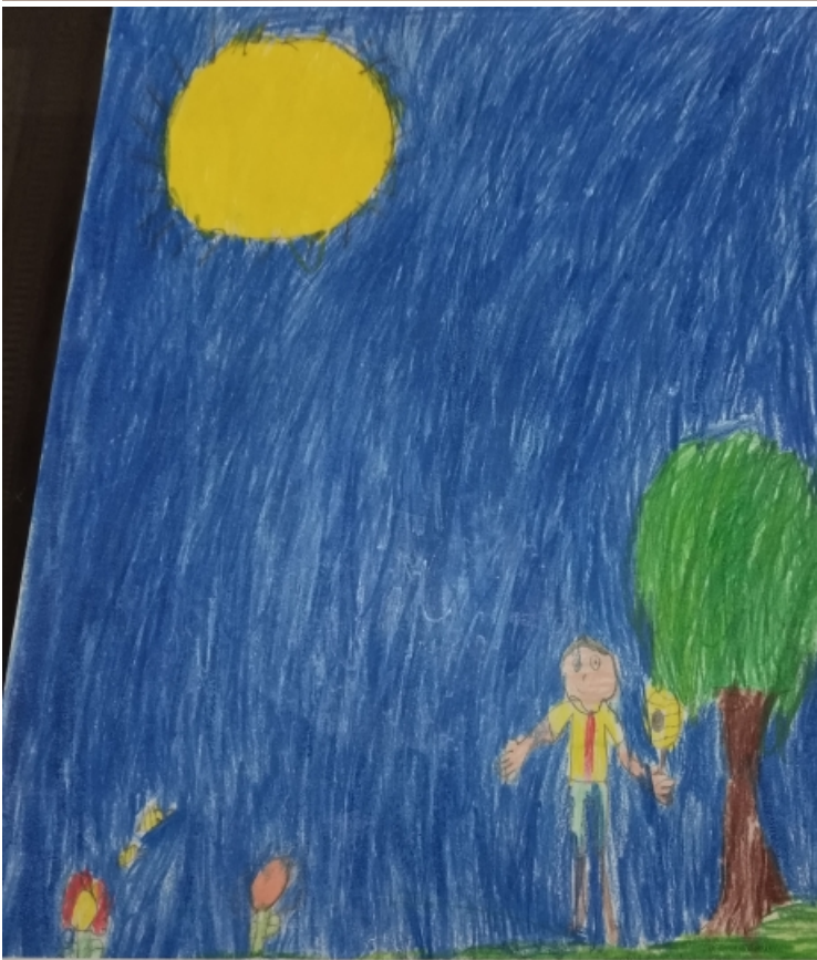
HISTÓRIA DA ABELHA