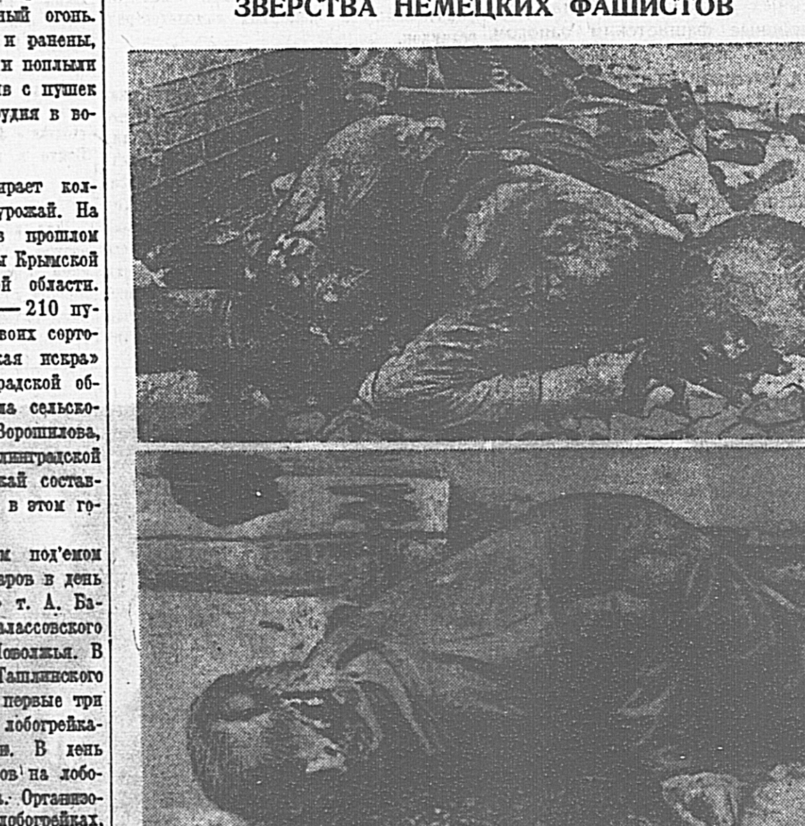
На снимке сверху: группа красноармейцев и командиров Красной Армии, сложивших немцам тяжелые пушки и выдвигавших в гор. Острове. На снимке внизу: зенитки убитых германских фашистов в гор Острове работавшие железнодорожники; ему выстрелили в голову разрывной пулей.