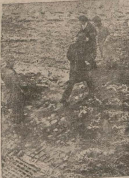
Dün İstanbulun sokakları vıcık vıcık idi.

Karadeniz ve Akdenizde müthiş bir karayel fırtınası var