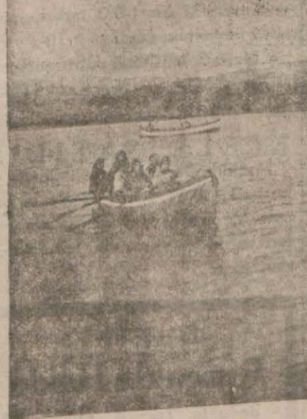
Ereğlide Kâğıthane ve Göğsudan da mükemmel bir Sefa yeri: Güllünc Nehri

Ereğli belediyesinin senelik varidatı (15000) lira tutmaktadır. Bu kadar para ile ancak belediye vezvaffak olmuştur.