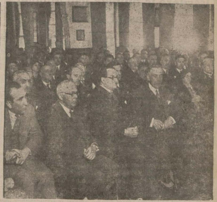
Halkevinde dünkü içtimaa gelenler