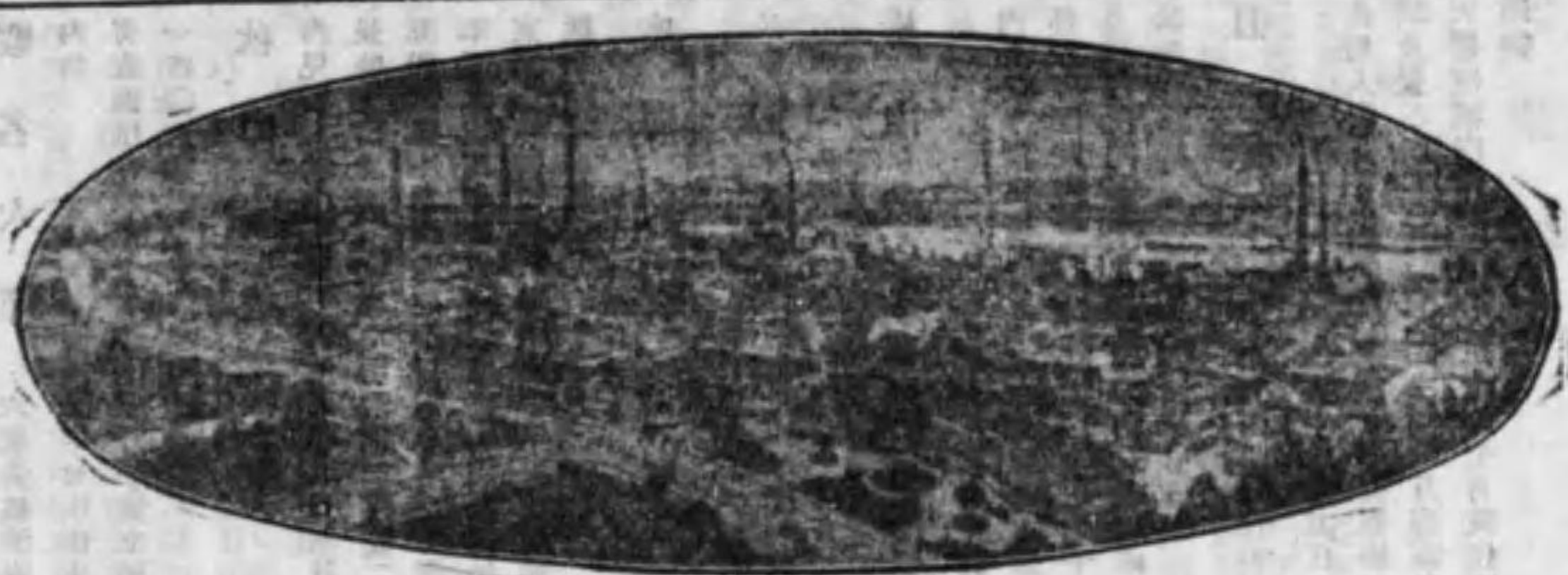
景全社會業工學化ルゼーバ西瑞