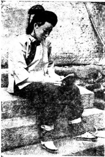
↑ 桃源中婦女裝束。束髮成髻，梳髮像一掃帚。 天是尖頭鞋，雲是素。