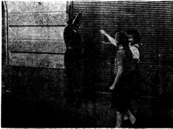
◇ 德國之新國民：羅馬尼亞兒童與德籍警察相互交換納粹式敬禮。

無論如何，德意之制霸巴爾幹，總要在地中海及遠東之優越權為前提，同時，要與蘇聯劃分勢力範圍之協定為條件。巴爾幹之戰局既如上述，目下我們還不能想像到與德意有利的情勢。