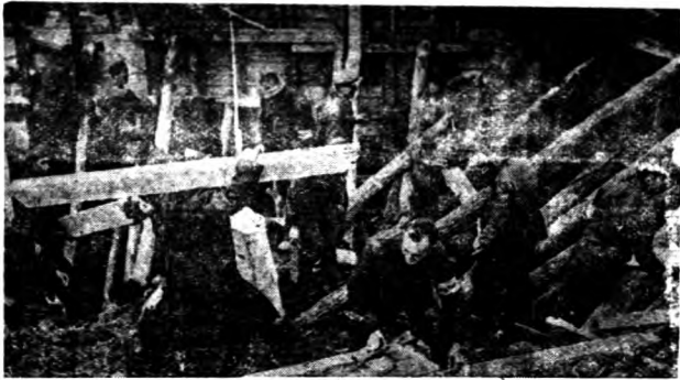
隊務服民市林柏之造建室下地空防於力努

狀況，因為報紙上不登載，無從知其真像，僅備聽到一些道聽途說，譬如：前天晚間聽說是死傷十五六個人，昨天晚間死八個人，某一帶地下室。因為受到炸彈，水道鐵管破壞，有許多人未及逃出而被溺死等等這一類的話。