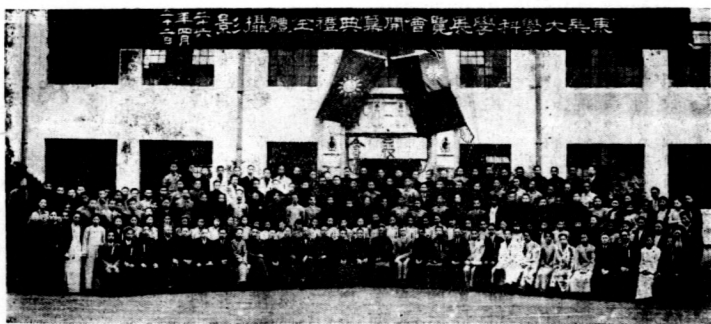
本校科學展覽會開幕典禮全體攝影