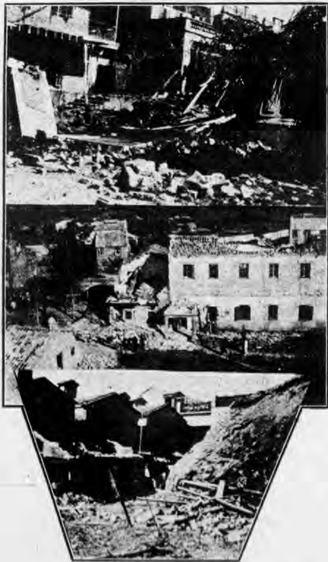
(上) 新寧鐵路 公司門首