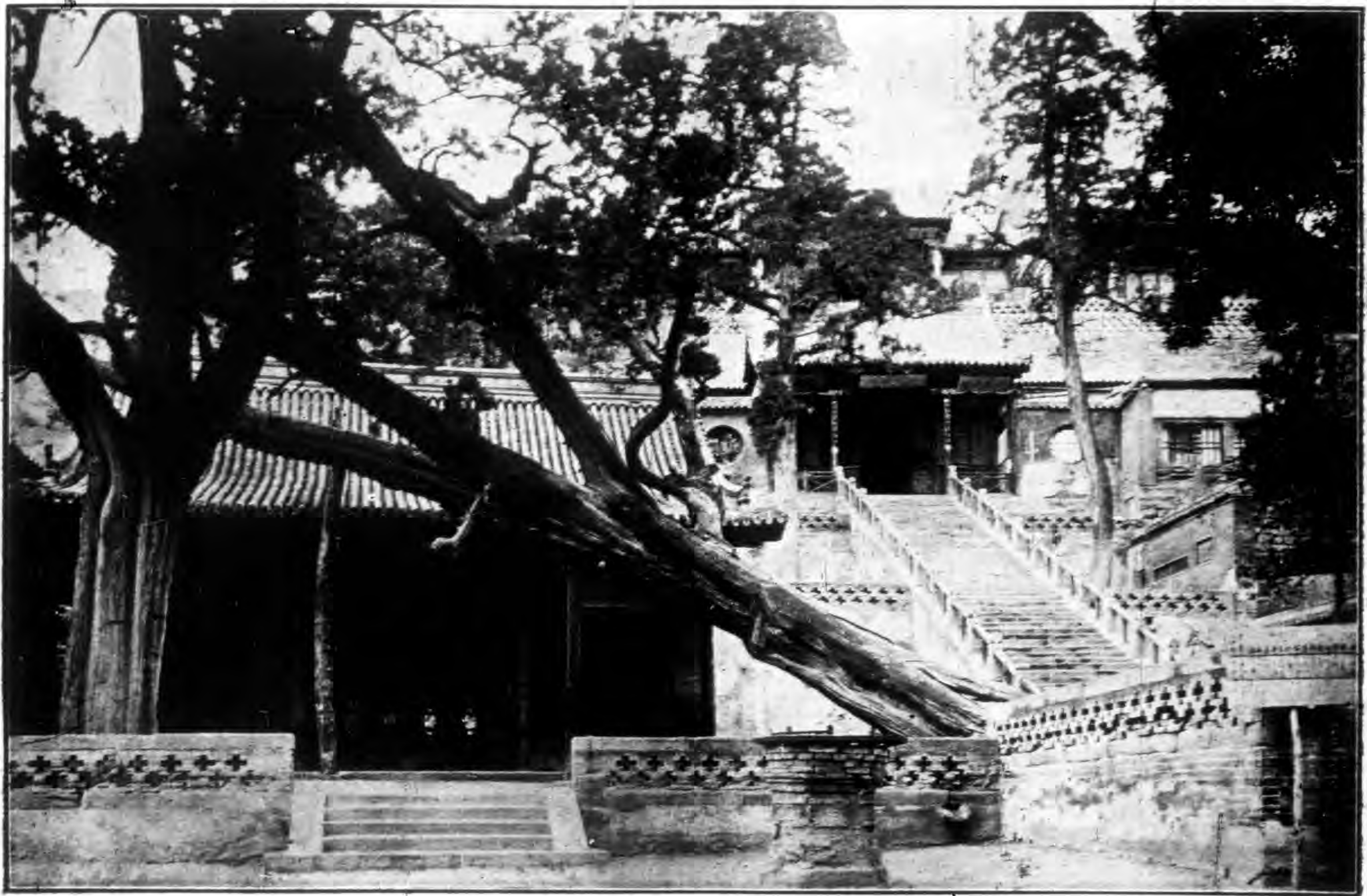
山 西 晉 祠 朝 陽 洞 前 古 栢