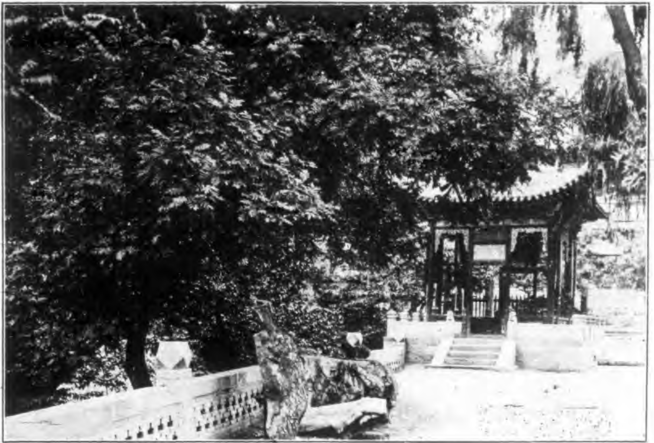
晉 貞 祠 極 亭