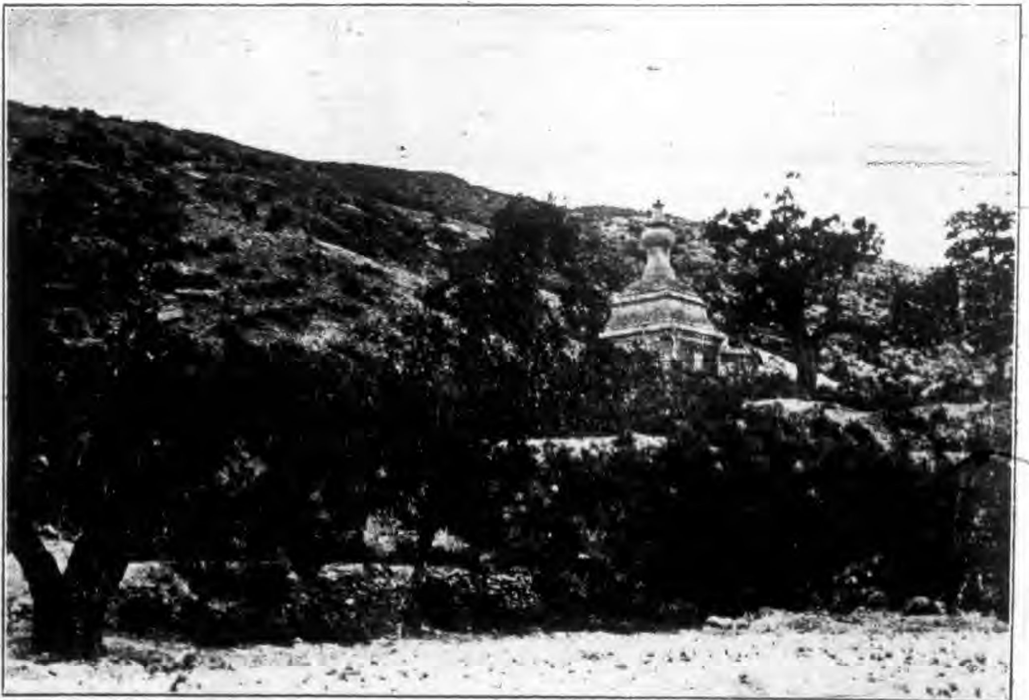
晉 萬 佛 祠 萬 塔