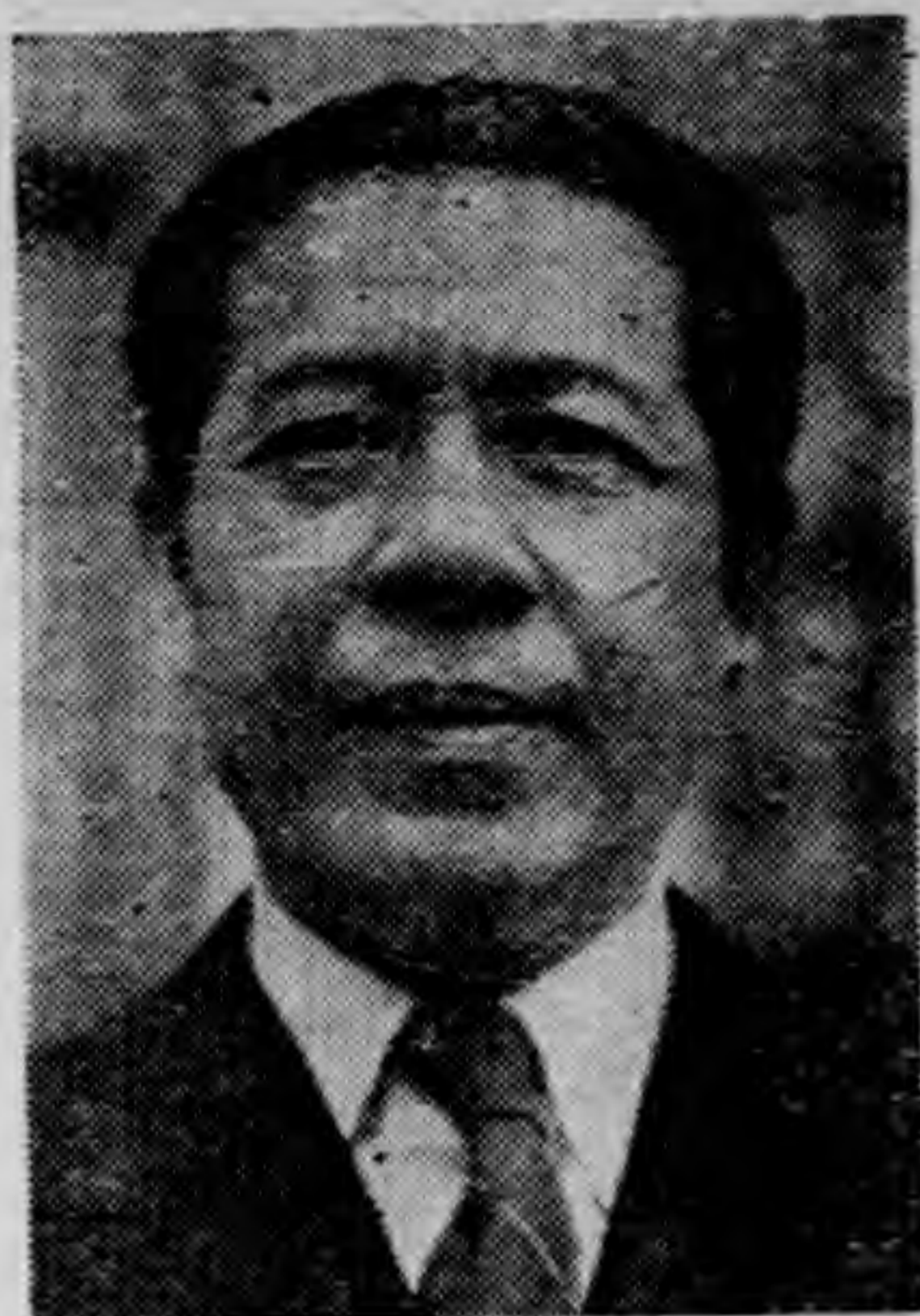
陳 院 長

本院依國民政府組織法第二十六條之規定，為國民政府最高立法機關，有議決法律案預算案大赦案條約及其他重要國際事項之職權，本此職權故本院組織法第一條規定，有法制外交財政經濟軍事等委員會之設置，以分任立法工作之專責，其於各種法案之進行審