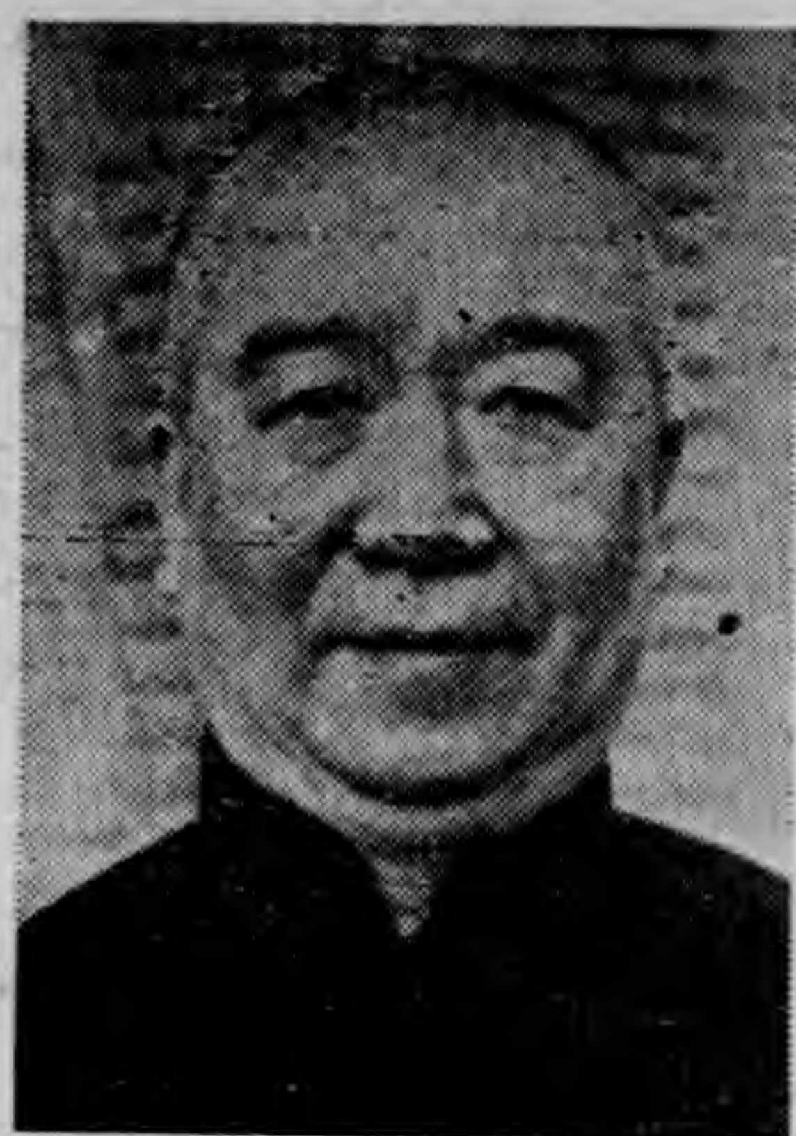
梁 院 長

本年五月准行政院咨，以據浙江省政府呈浙江行政已逐漸推進，關於經費之審核，日見繁重，有恢復審計處之必要，當經轉審計部遴員將浙江省審計處，提前恢復，呈奉國民政府核准於本年六月組織成立。