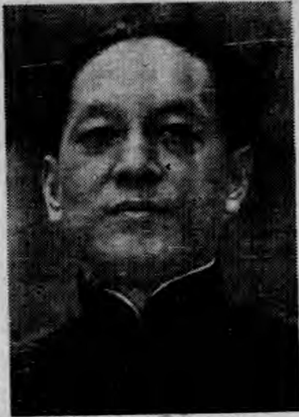
岑 委 員 長

查本年振務除辦理結束各省市上年冬振外，復以蘇省海州一帶，去年水旱災荒，當時未據查報之東海，灌雲，贛榆，沐陽，宿遷各屬，以及新歸和平區域，蘇之泰縣，浙之紹興，甯波等處，天災人禍，均需輸入食糧，以資急振，經本會購辦振糧，撥發振款，分別派員前往，會同當地士紳團體，調查散放