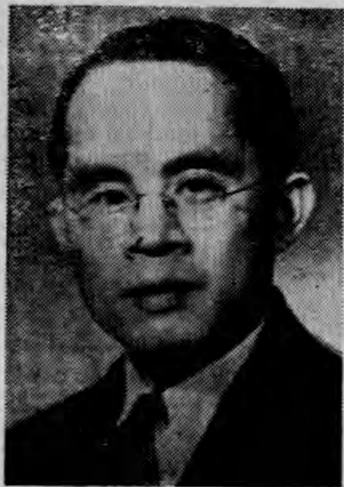
林 部 長

(甲)指導方法：本部為全國宣傳最高機關，對於國內一切宣傳機關或團體，都應予以密切的指導，務使全國宣傳機構，不僅收齊一步伐之效，且益加增其效率。其中又分(一)一般指導：是由本部擬訂了宣傳計劃後，把宣傳要點，隨着時事的動態，指導各機關各報社各刊物以及通訊社等，予以參考，使從事宣傳者，可獲得一個中心點，或加重新聞力量，或撰著專論，庶可集中宣傳的力量，提高宣傳的效力。(二)報紙指導：是專對着報紙的一種指導，其於積極方面，有時予以方針的指示，有時予以資料的供給。其於消極方面，則或予以糾正，或予以禁止，務使各報社的記載，不問為新聞，為言論，都要發揮他正確的力量。(三)雜誌指導：是在審核各雜誌的內容後，而隨時分別予以改進，其有缺點者則指示而糾正之，其應推進者，則指示而