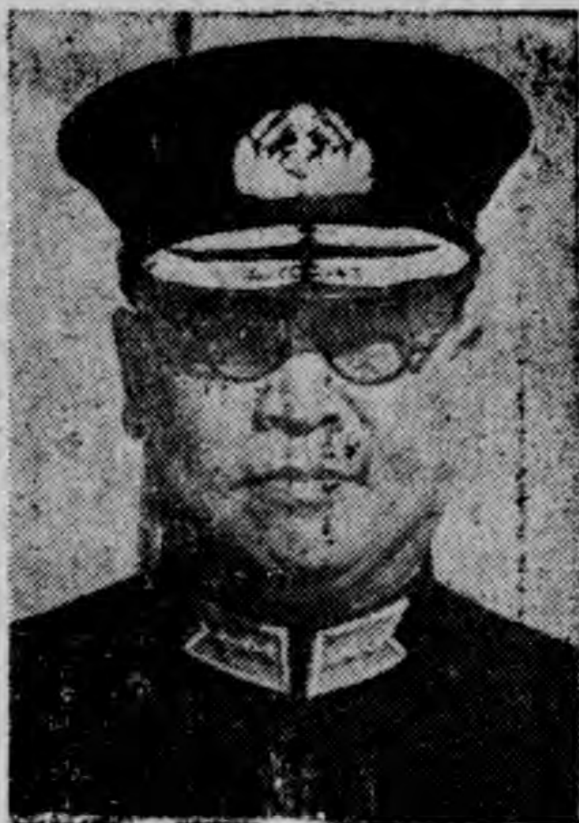
任 部 長

本部自隨國府遷都成立迄今，將屆兩載，回顧一年來之行政，凡百設施，概循政府建軍方針，積極策效於推進。其中事業最著而易於稽考者，即為初期原有少數艦艇，現已逐漸擴充至五十餘艘，以之分