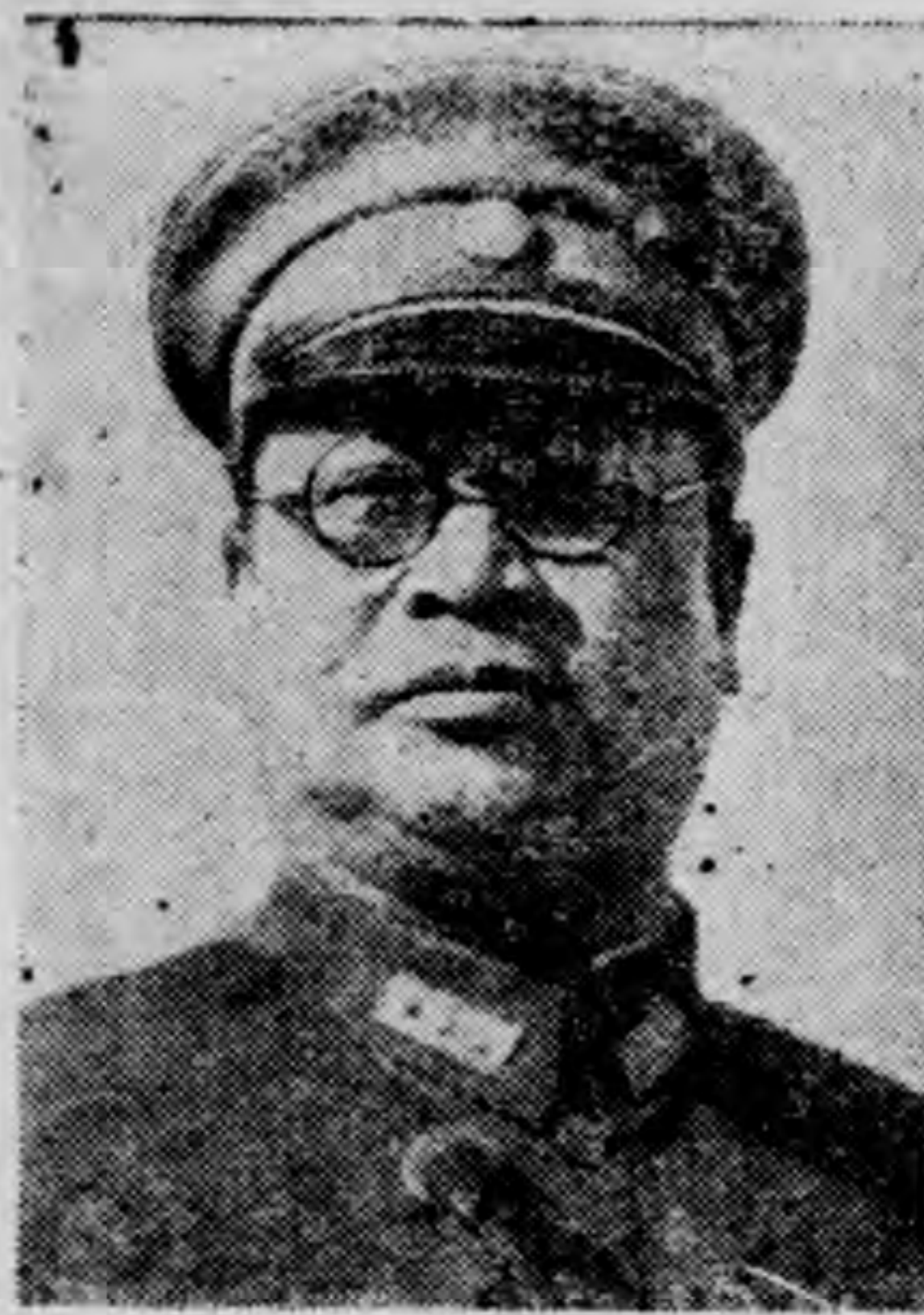
任 院 長

(子) 審查各參議諮議之資歷，以便分配任務，查本院各參議諮議，平時專備諮詢建議，並得擔任點檢校閱演習調查屯墾兵士及特派等事，並為研究學術增益智能，得設各種軍事研究會，其任務至為重要，故對於各員資歷不得不詳細審查，以期分配適當。