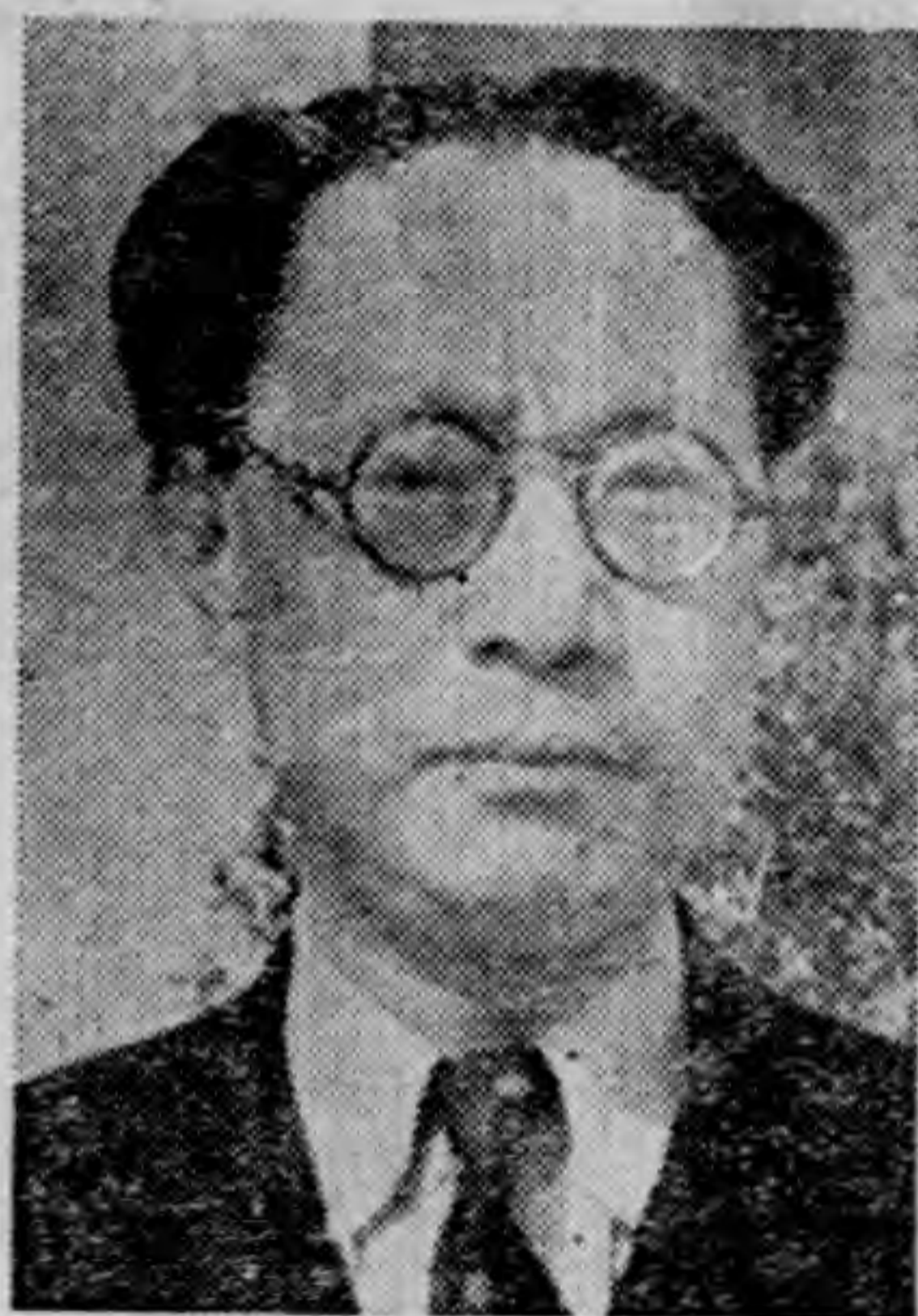
周 部 長