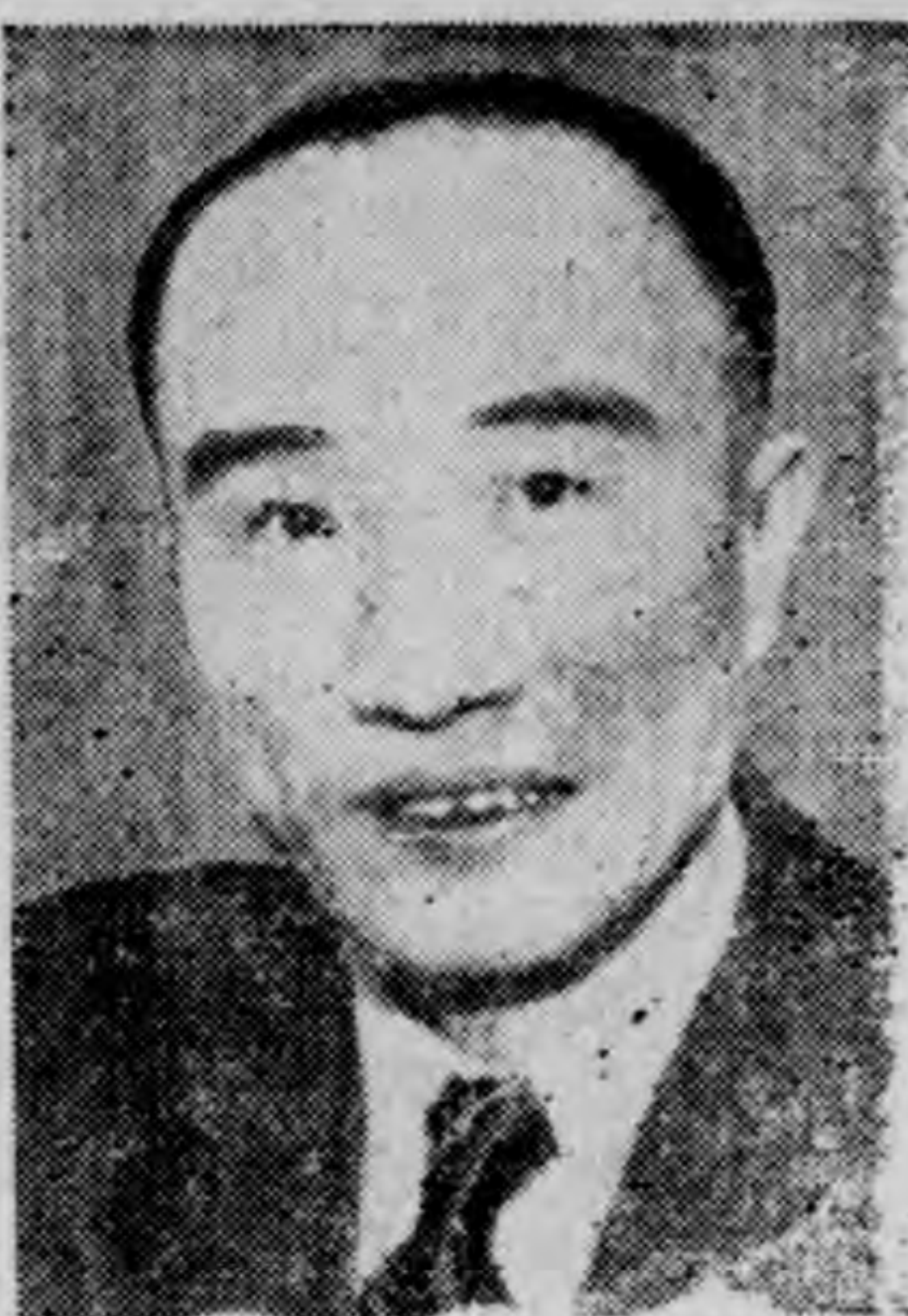
梅 部 長

一、舉辦食糧增產 中國以農立國民食問題，歷來為政府當局所重視，然民食之需求，終未能達到