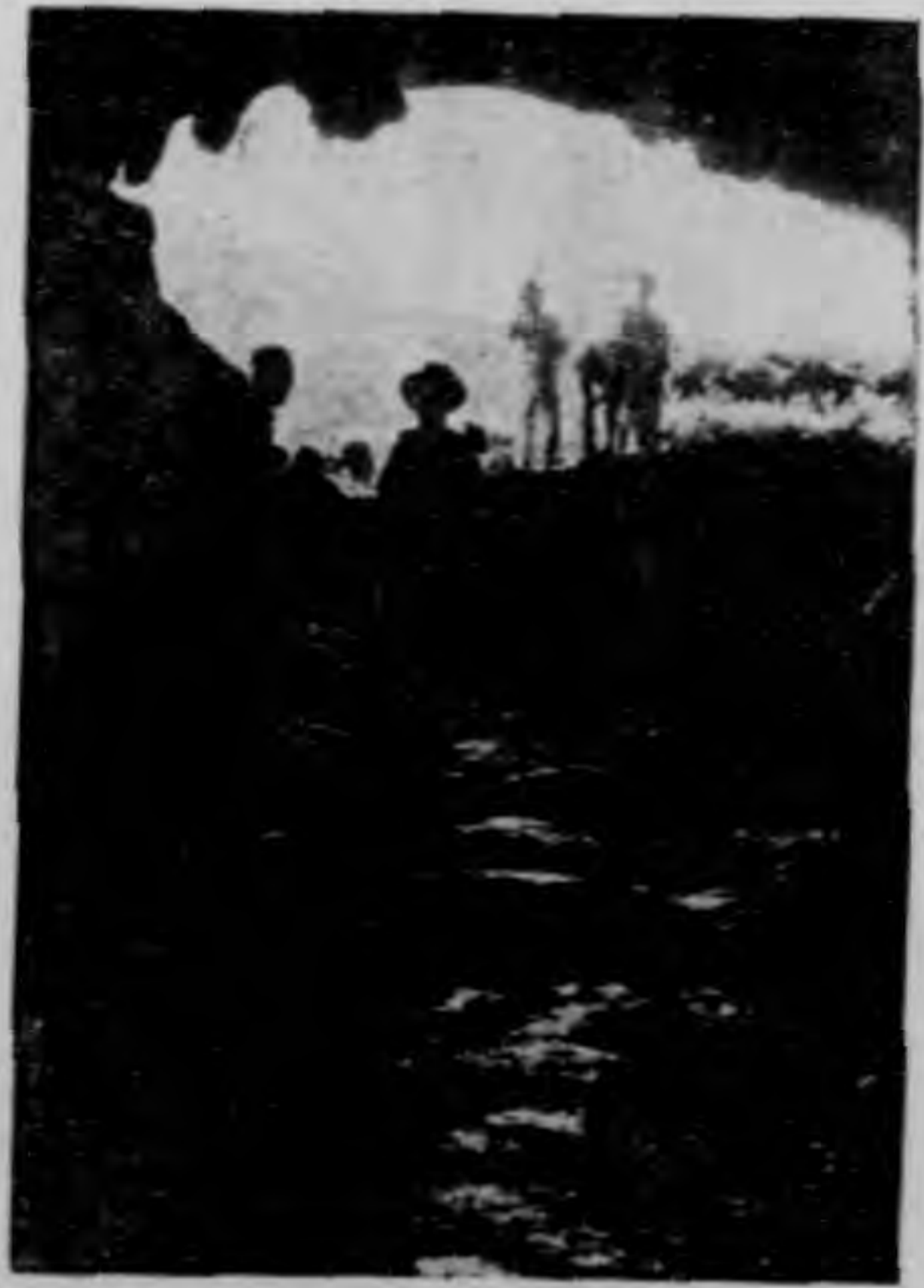
(四十圖) 像景時洞出巖星七

行，忽然大放光明，已到洞口了。因為好奇的關係，我到洞口就請引導的人，把他所說的名物一一的記了下來，茲寫在下面：