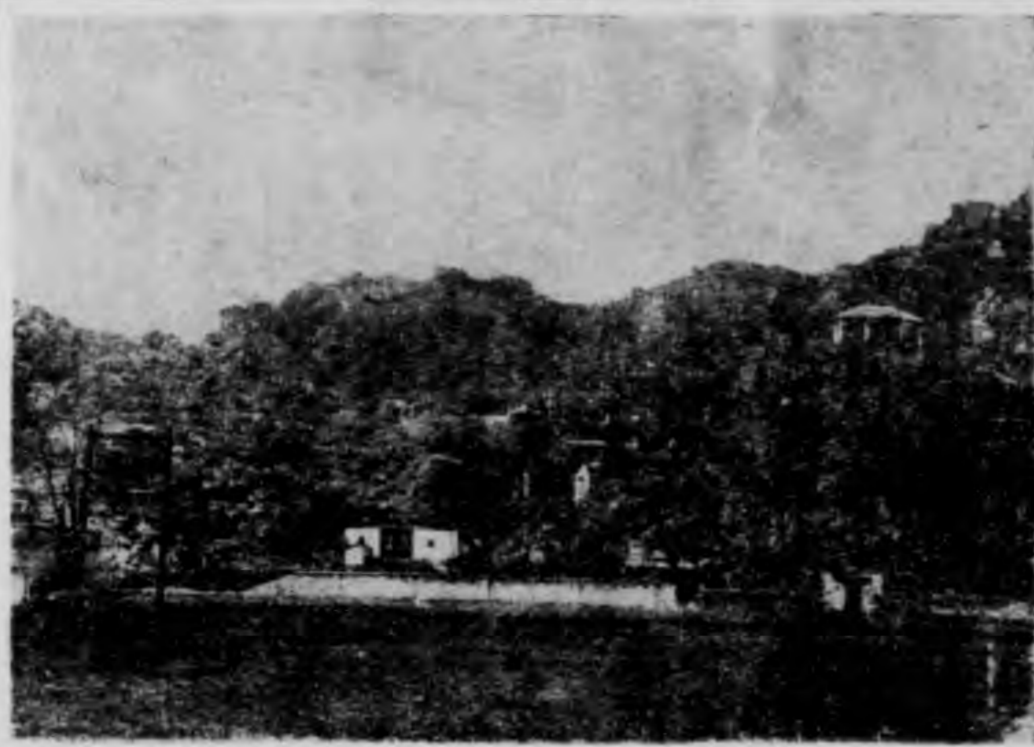
(一十圖) 山 綵 疊

二十日晨，由桂林當局招待作一日之遊，預定的行程：早晨遊 疊綵山 ， 虞山 ，下午遊 月牙山 ， 龍隱巖 ， 普陀山 ， 七星岩 。茲把遊踪分述於下：