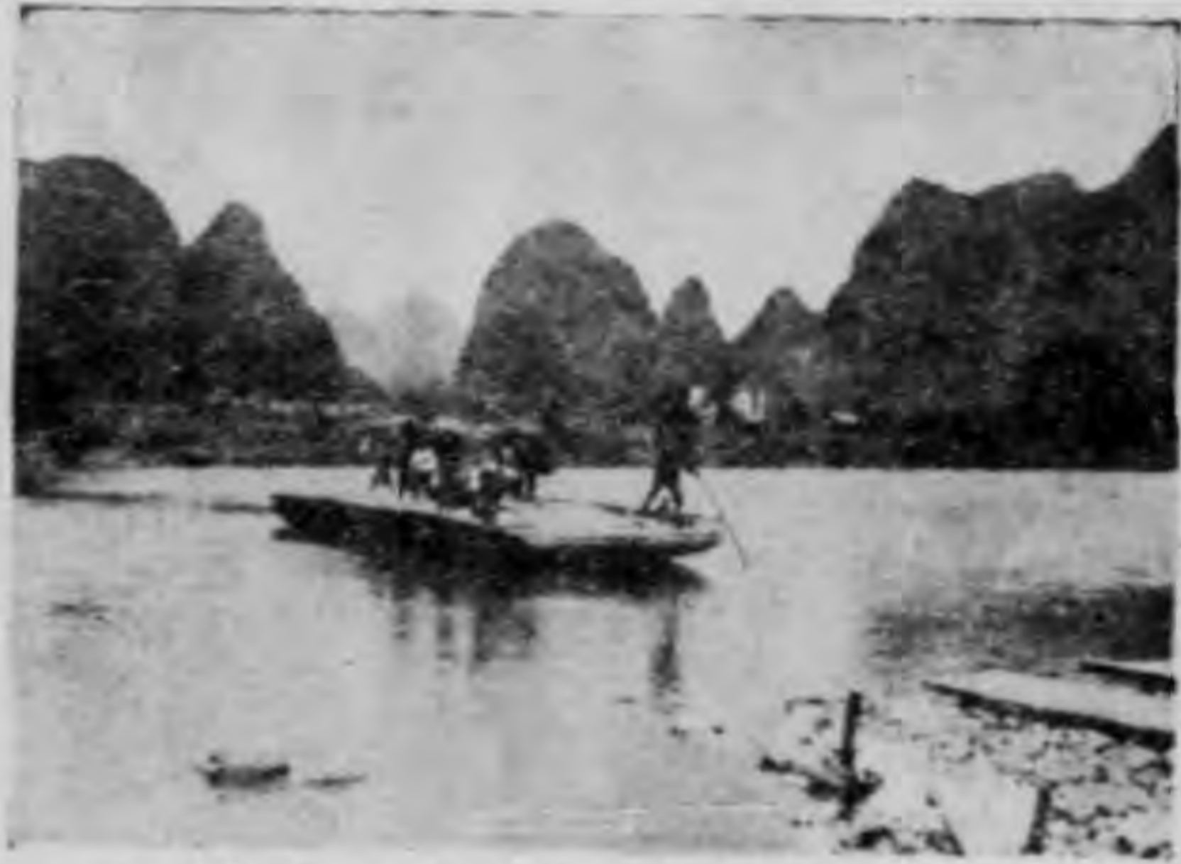
(九圖) 船渡之河渡車汽運及色山朔陽

山徑，下臨灘江，前對諸峯，水流激湍，一瀉直下。山城離水有三四丈高，岸上建有水閣，我們倚閣俯視，來往的風帆皆由此經過，形勢極為雄偉。並且隔岸的山色，蒼翠的