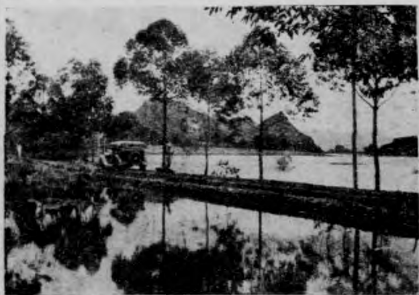
(八圖) 徑路場驗試林農赴