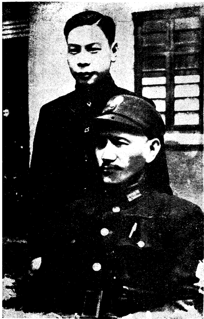
蔣總統偕蔣經國氏合影