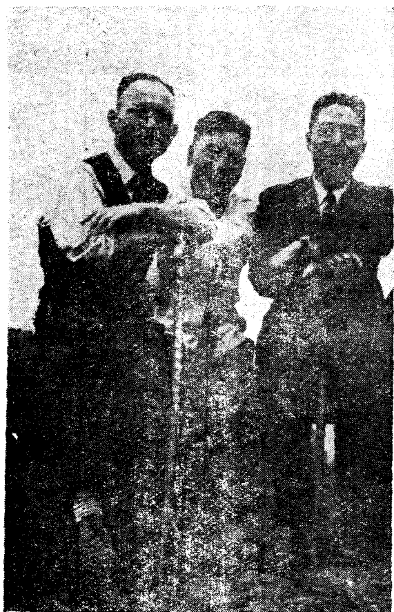
蔣經國氏與高理文俞季虞氏合影