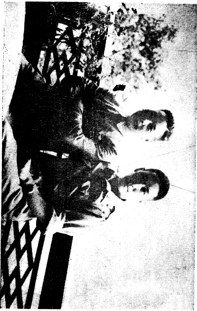
蔣經國與弟緯國合影