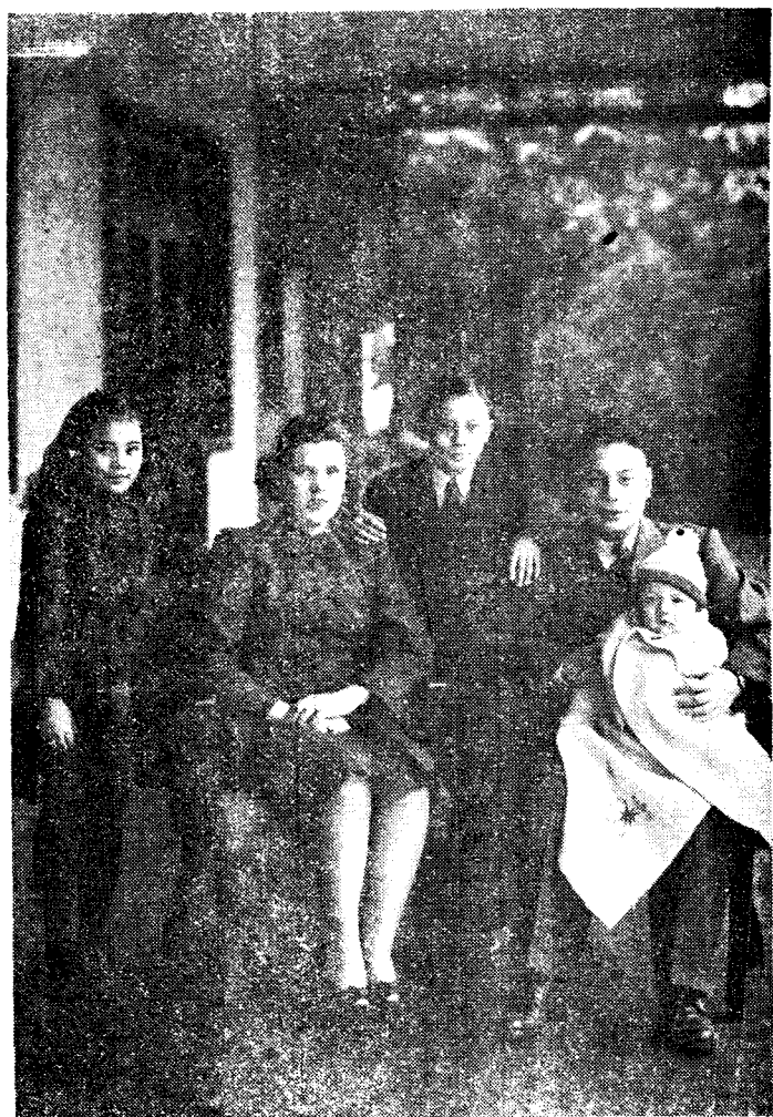
蔣經國氏與家屬合影