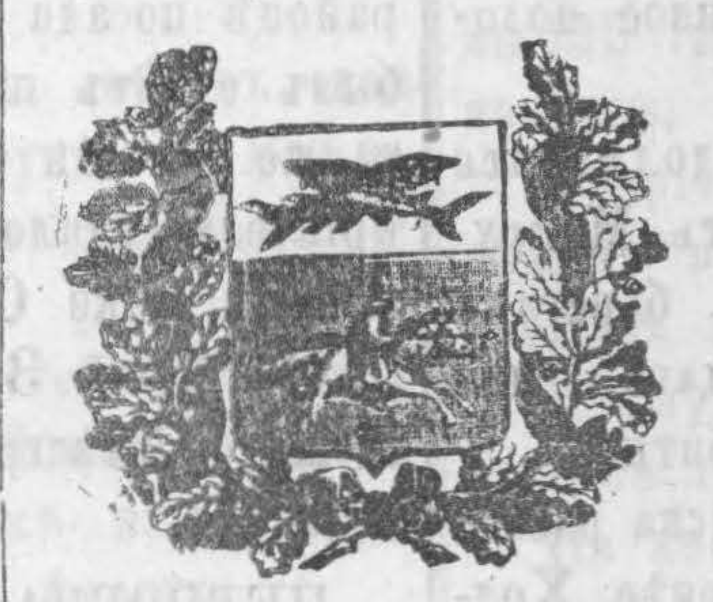
100 №№ вь годъ.