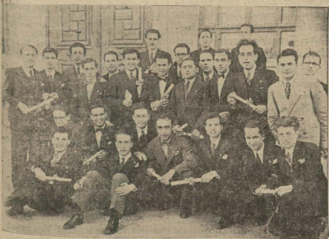
Mühendis mektebinden bu sene diploma alan gençler

Yüksek mühendis mektebinin yeni mezunlarına dün diplomaları dağıtılmıştır. Bu münasebetle mektepte güzel bir münasabete verilmiştir. Mektebin fizik müderrisi Salih Murat bey bir konferans vermiş, bu seneki mezunlardan Şevki bey arkadaşlarının duygularına tercüman olmuştur.