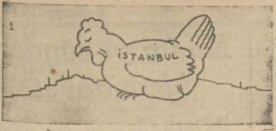
Aç tavuk kendini...