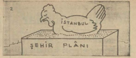
... Arpa ambarında sanır l..

Sene 16 — No: 5590 — Fıatı her yerde 5 kuruş