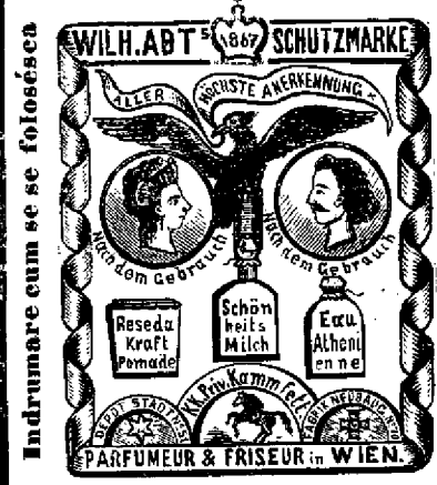
Indrumare cum se foloseasca se dá in 6 limbi.

1 Flacon (sticluti'a) de oleu filtratu de unu perulu cu ori fara parfumu 1 fl., in forma de pomada intr'o ladutia decorata in modu elegantu 60 cr., ca cosmetica (medicocu de frumsetia) 50 cr., pomada de asta' pentru a colorá perulu in negru séu brunetu costa o ladutia din sticla de alabastru 1 fl., ca cosmetica 50 cr., pomada de barba, negra, blondina ori bruneta 25 cr., unu cartonu (o ladutia de hartia grósa) pregatitu in modu elegantu proviedutu cu 5 bucati c. r. privilegiate preparate de unu perulu, menitu spre decorarea unei mese de toaleta éra mai vertosu aptu pentru presente; pentru dame cu esbuchetu 3 fl., pentru barbati 2 fl. 80 cr.