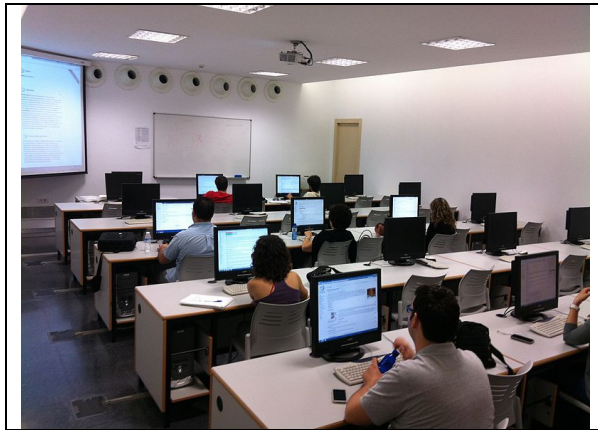
Taller de Viquipèdia a Gandia