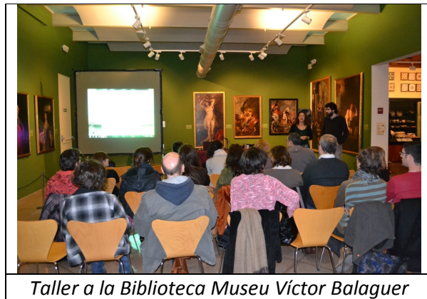
Taller a la Biblioteca Museu Víctor Balaguer