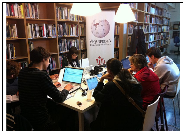
Viquipedistes editant durant la viquimarató Ángeles Santos al Museu de l'Empordà