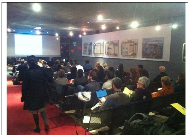
Presentació al Museu del Ferrocarril de Catalunya