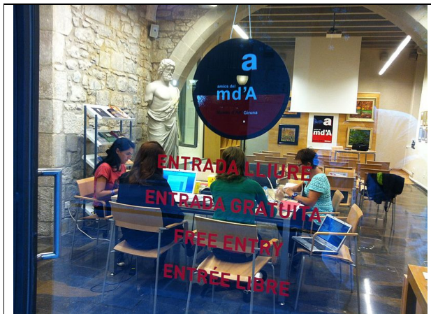
Viquipedistes editant al Museu d'Art de Girona