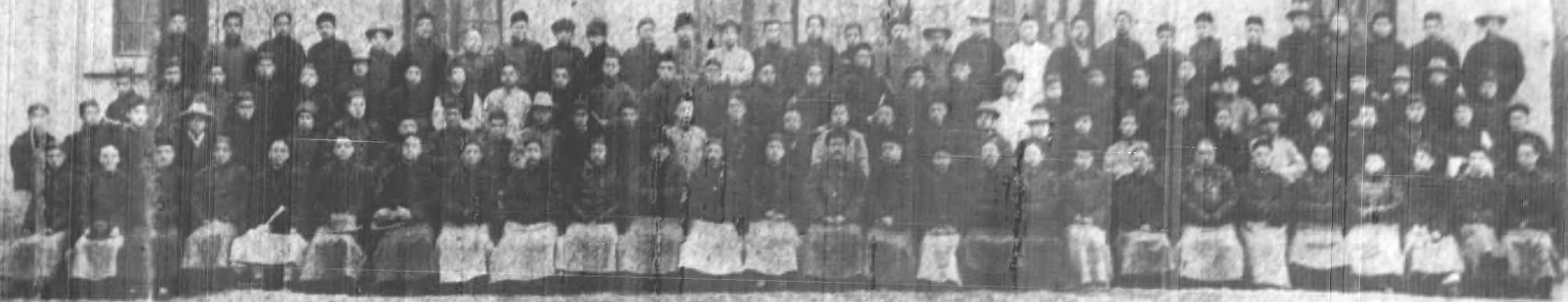
監督京師稅務公署稅務講習所開學式暨總辦職教學員全體攝影

監督京師稅務公署稅務講習所開學式暨總辦職教學員全體攝影 中華民國二十六年三月六日