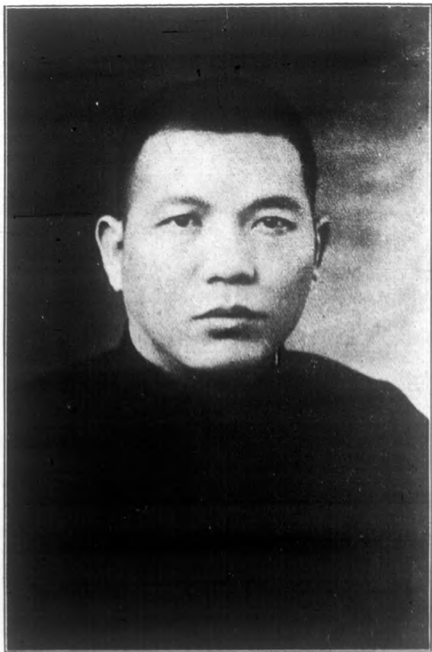
主 席 兼 民 政 廳 長 黃 紹 竑