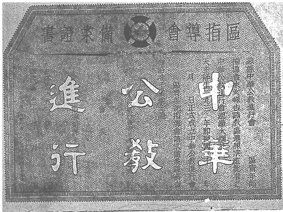
字大六「行進教公華中」，字黑地黃，寸二尺一尺官寬，五寸八尺官高證案備此 別區有各部年青部女婦部子男，色顏角四形字十篤本上，字白為則