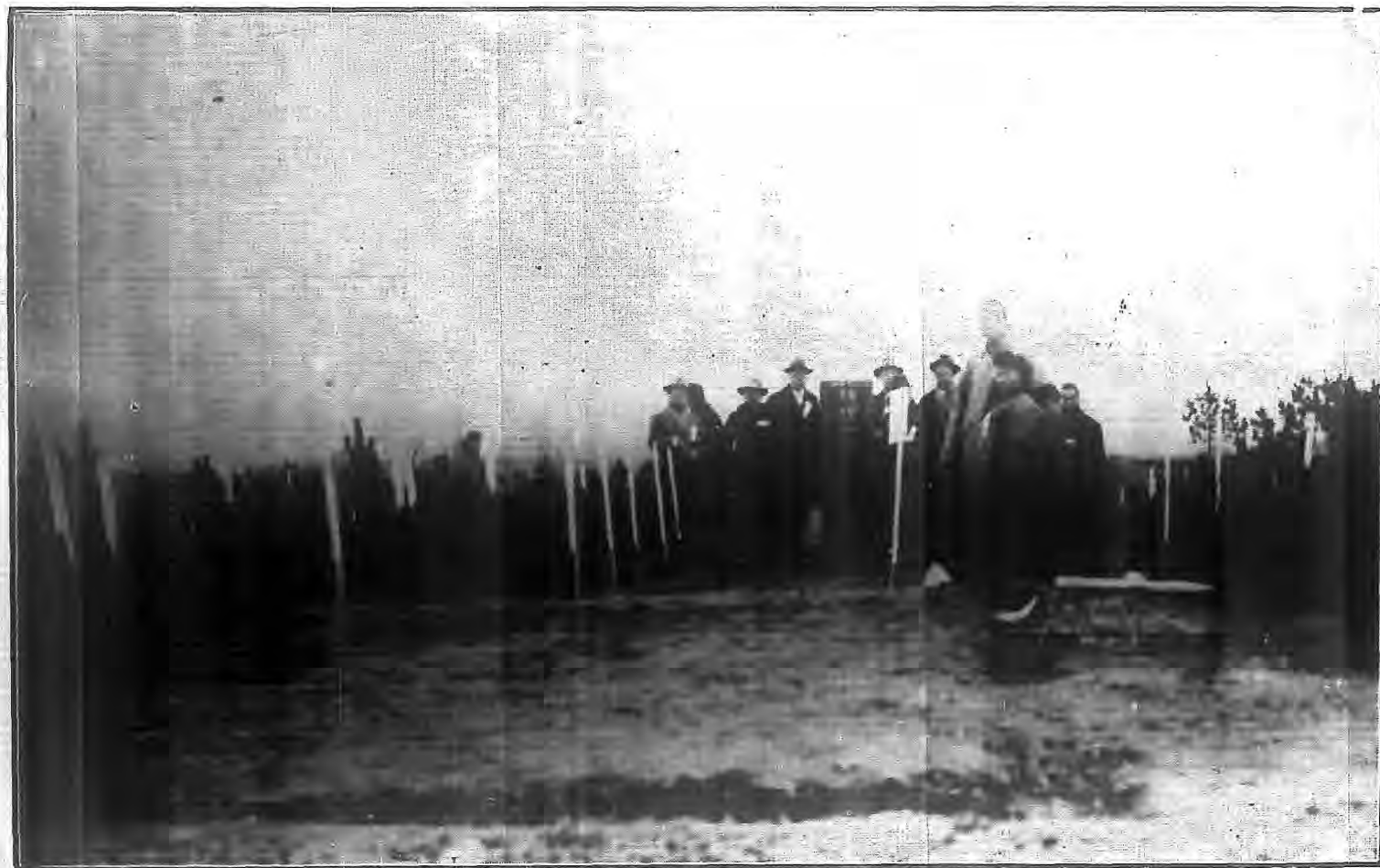
影 撮 場 樹 植