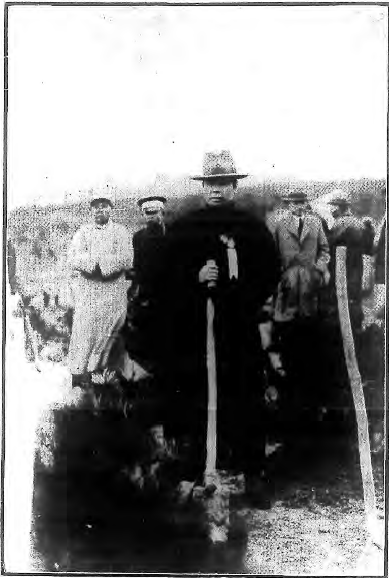
農鑛部易部長植樹攝影