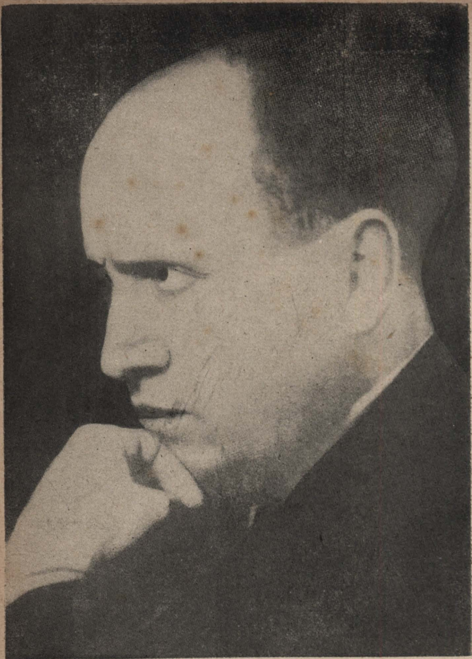
一九二二年的墨索里尼