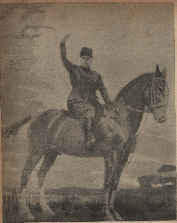
墨索里尼的馬上英姿