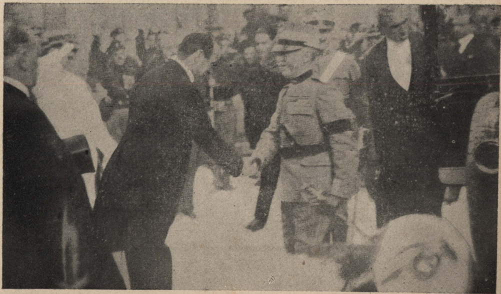
進軍羅馬後觀見國皇