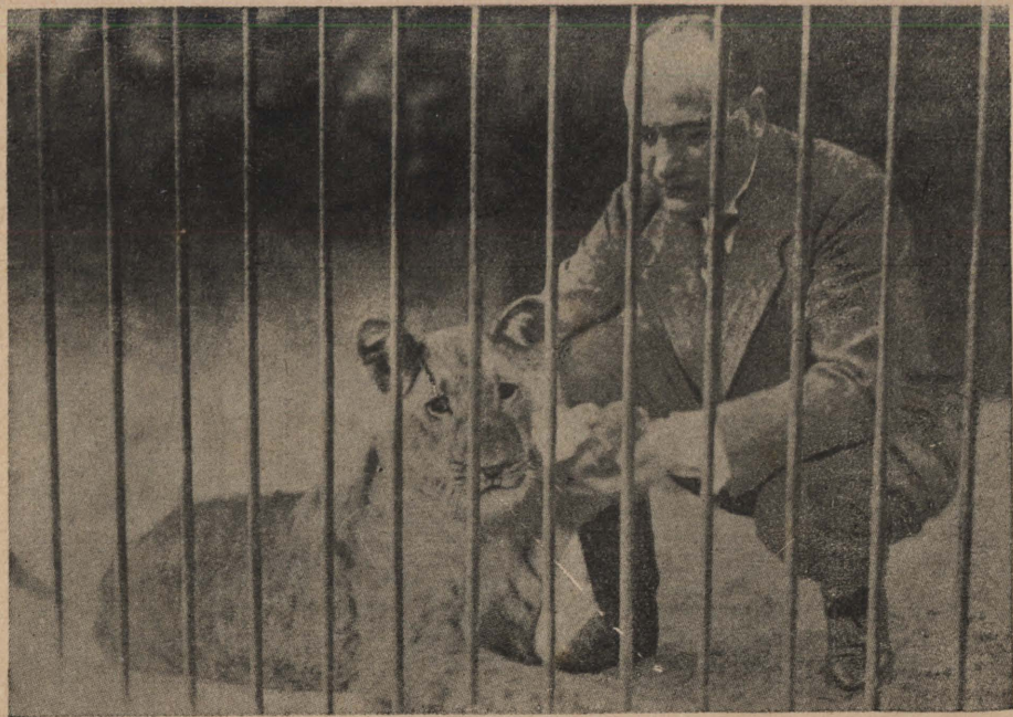
墨 索 里 尼 和 他 的 獅