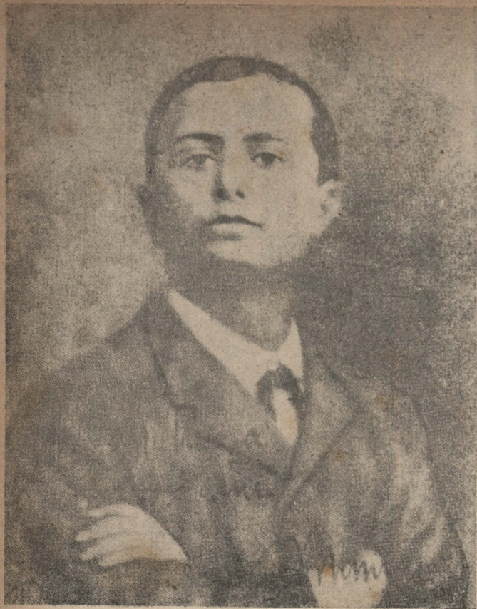
十四歲時的墨索里尼