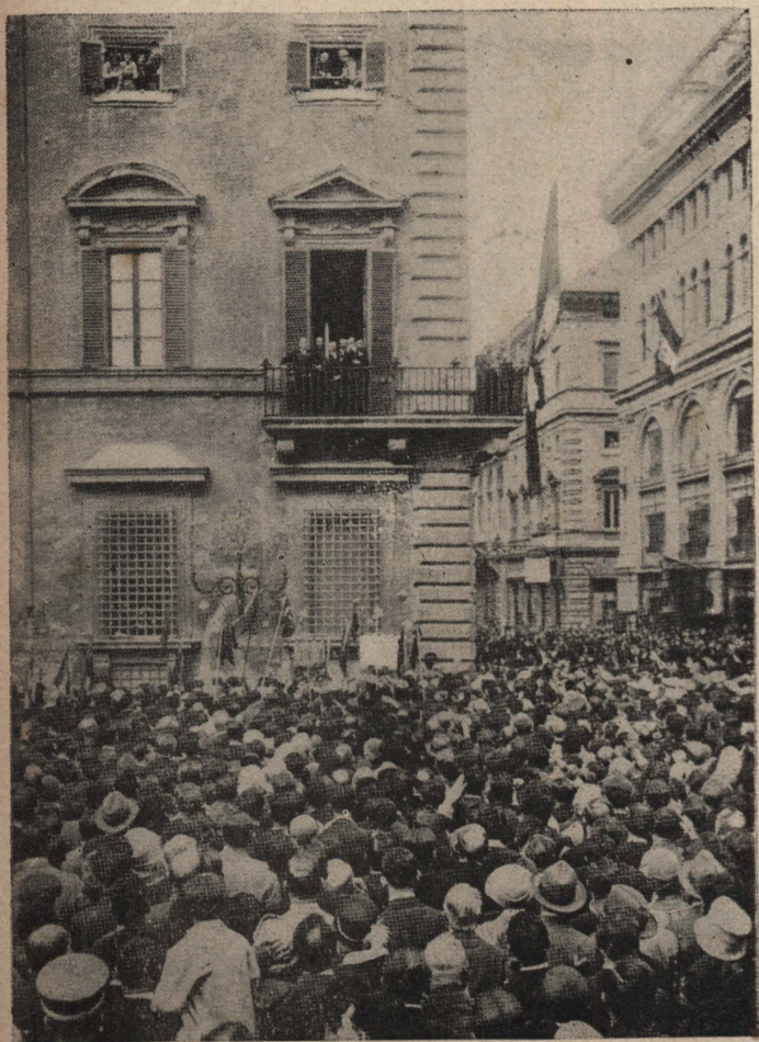
墨索里尼對衆演說