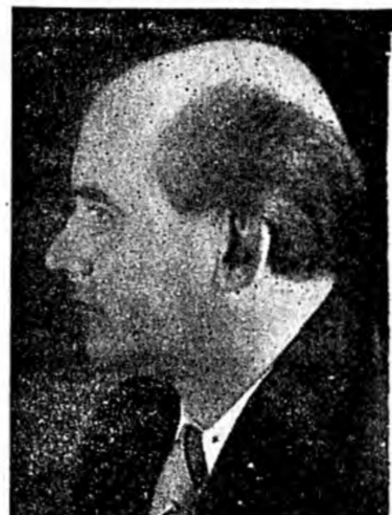
Peaminister dr. JOHAN VARES-Barbarus.