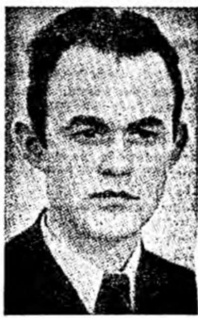
Sotsiaalminister NEEME RUUS.