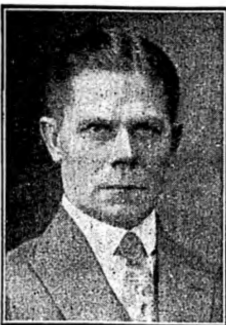
Peaministri abi prof. H. KRUUS.