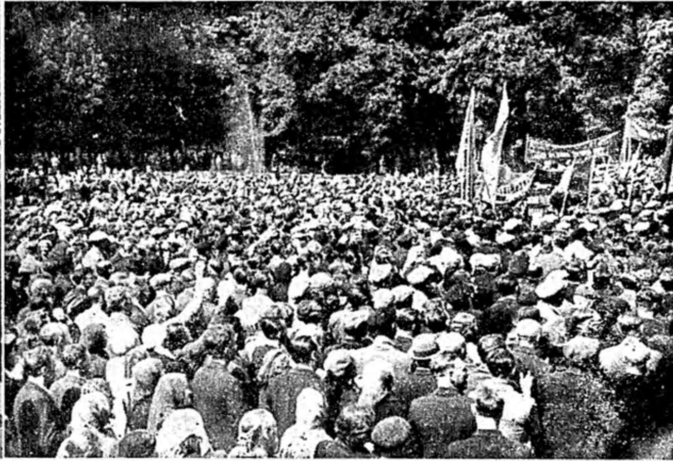
Töölise elselts meeleavaldusel. Vasakul — rongkäik on jõudnud Kadrioru lossi ette. Lossi rõdul vabariigi president K. Päts. Keskel — töölise juhü rongkäigu esotsas. Paremal töölisühulgan punaste lippudega Kadrioru lossi ees.