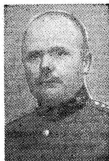
Sõjamineister kindral-major. TÕNIS ROTBERG.