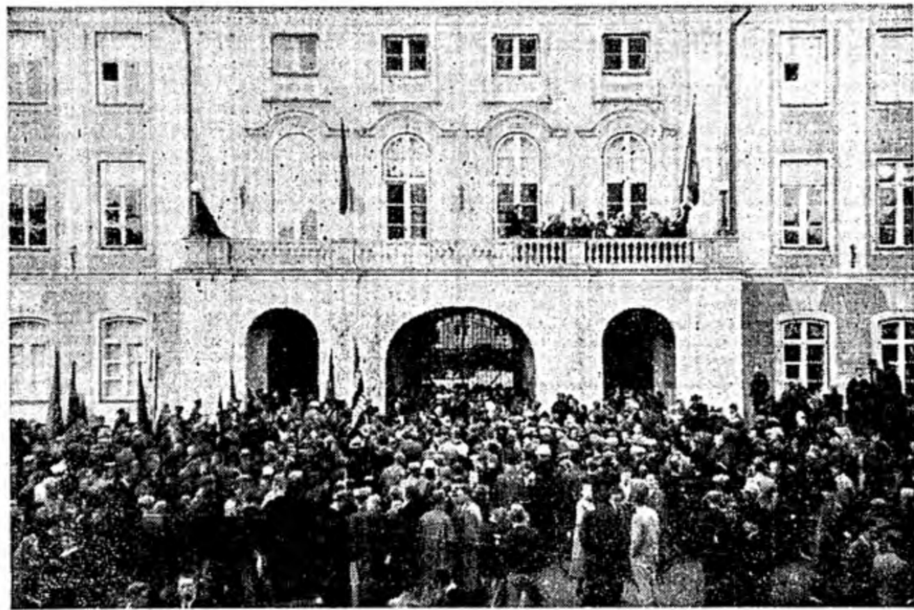
Meeleavaldajad Toompea lossi ees ootamas uue valitsuse väljakuulutamist.

Edasi võeti vastu tervitus punaarmeele, mis kõlab järgmiselt: Tallinna töölise koosolek Töölisevõimlas 20. juunil 1940. a. läkitab Punaarmeele ja tema juhtidele oma vennalik-sõbralikema tervituse. Koosolek kannatab, et Eesti rahva rõhuv enamus hindab kõrgelt Eesti ja N. Liidu vahelist abistamispakti, millega N. Liit on võtnud endale kohustuse — säilitada ja kindlustada Balti maal rahu. Koosolek mõistab hukka vastustundetu reaktsioonilise kodanluse oosa mahhinatsioonid Balti sõjalise liidu sõlmimise näol, mis oli sihitud N. Liidu vastu ja ähvardas meie ja teised Balti rahvad tõeata laastavasse imperialistlikku sõtta. Stalini, Molotovi ja Vorosilovi ja teiste N. Liidu juhtide tark rahupoliitika on õigenegeelit kiskunud kätte neil sepiustel ja ulatanud vennalikult abistava küe meie töötavale rahvale. Võimsate Punaarmee väeotsade Eestisse jõudmine on meile kindlustuseks, et võime rahulikult jätkata tööd oma kodus ja meie palavinim soov on, et ka Punaarmee tunnecs end siin kodusena. Elaugu töötava rahva rahvusvaheline solidariitet! Elaugu võimsa Punaarmee ja tema juht Vorosilov! Elaugu rahvaste juht Stalini! Parimad tervitused meie Stalini, Molotovi, Zdanovile! Lõppeks otsustati saata tervituslegrammi Stalinile. Koosolek lõppes kell 10.15 öhtul.