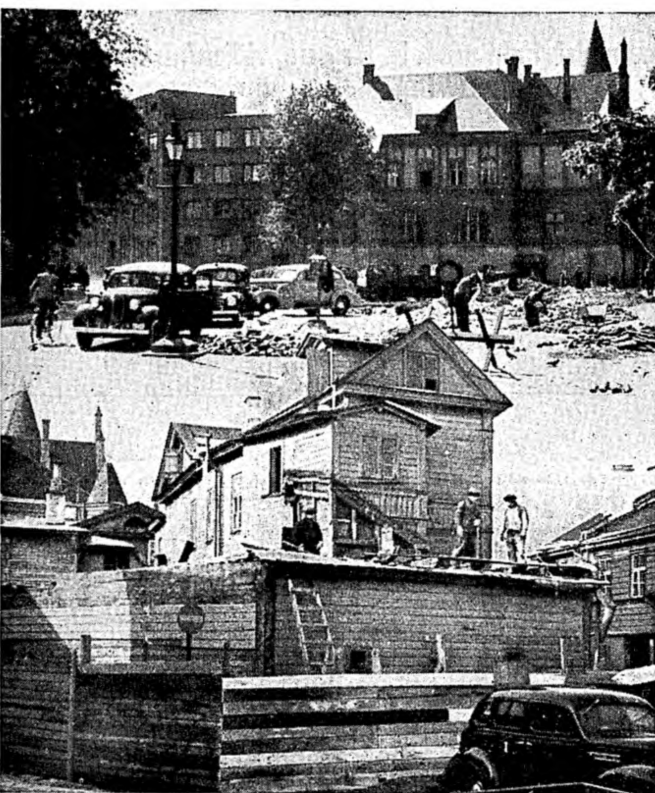
Uial — nlsungene on praegu Sakala ja Kaupmehe tänava nurgakrunt. All — sama koht enne majalagutidkuga.

Raskejõustikuliit on hooaja lõppemisel võtnud suveperioodil tegevuskavasse kümnesed eelolevaks hooajaks ja uute suundade küsimused raskejõustiku alal üleriigilises ulatuses. Maakonkadevahelised karikavõistlused maadluses, tõstmises ja poksis venisid tänavu liigelt pikale ja linnalid peeti kevadperioodil hiljemalt kui meistrivõistluste nel aladel. Alates eelolevast hooajast on kavatsusel panna kehtima reformikavad raskejõustiku võistluste korraldamise alal siseriigilises ulatuses. Eelolevast hooajast alates pannakse kehtima uus kindel võistlus kalender siseriigilises ulatuses võistluskalender siseriigilises ulatuses koostatakse juba oktoobris. Esmajoones teostatakse maakonkadevahelised karikavõistlused maadluses, tõstmises ja poksis, võistlustega alustatakse juba novembri teisel poolal ja need tuleb lõpetada hiljemalt jaanuari viimisel nädalavahetusel, kusjuures võistlustähtpäevad üleriigilises ulatuses määrab kindlaks raskejõustikuliidu juhatus. Seega peetakse maadluses, tõstmises ja poksis ühe-voorusid kõikidel aladel üheaegselt kindlal tähtpäeval. Finaalmatšid peetakse siseriigilises ulatuses neid ei korraldada enam erapoolelt, pinnal Tallinnas läinud aasta eeskujul. Maakonkadevahelised karikavõistlused on mõeldud peamiselt raskejõustiku propagandana üleriigilises ulatuses. Raskejõustiku kütumist Tallinnast, et vältida läinud hooajal ilmnunud protestide lavinat.