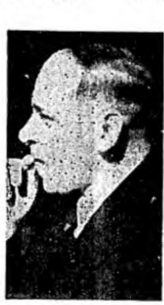
Haridusminister JOHAN SEMPER.