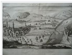
Camsdorfer Brücke im Jahr 1735