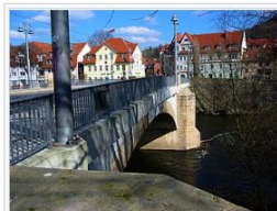
Camsdorfer Brücke nach der Sanierung