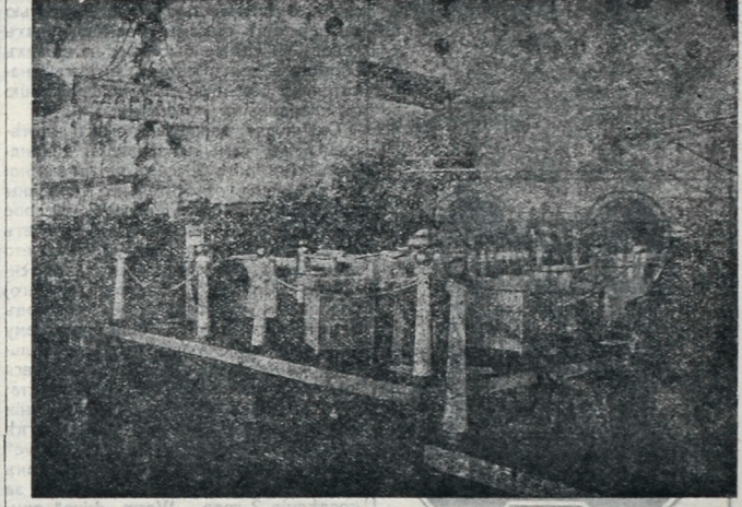
Станлъ журнала „Автомобилистъ“ и газеты „Ауто“.

— Знаете,—говорилъ онъ,—если бы спортъ широко проникъ къ намъ, ворвался свѣжей струей въ душную школьную атмосферу, если бы онъ захватилъ наше растущее поколѣніе—не было бы нравственныхъ уродовъ, не калѣчились бы такъ молодая, неокрѣпшійя природы, разрываемаея гнилой современностью. И наша работа была бы легче, а мы гордились бы созна-