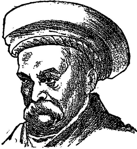
लोकहितवादी गोपाळ हरि देशमुख (इ. स. १८२३ - १८९२)