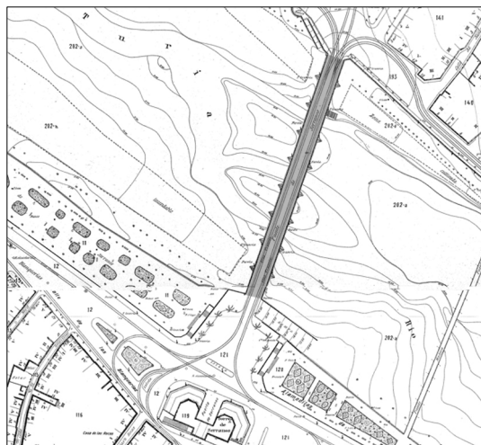
Cartográfico Municipal 1929-1945