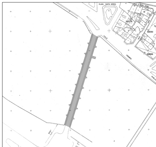
Cartográfico C.G.C.C.T 1980