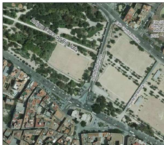
Fotografía Aérea 2008

Cartografía Catastral: -- Manzana: -- Parcela: -- CART. CATASTRAL 401-11-IV IMPLANTACIÓN: PUENTE FORMA: REGULAR SUPERFICIE: 159,7 x 11,2 m