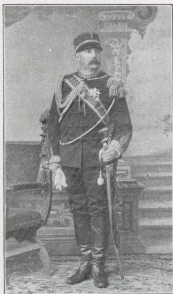
Generaal van Heutsz