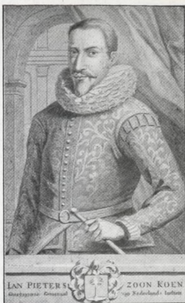
Jan Pieterszoon Coen