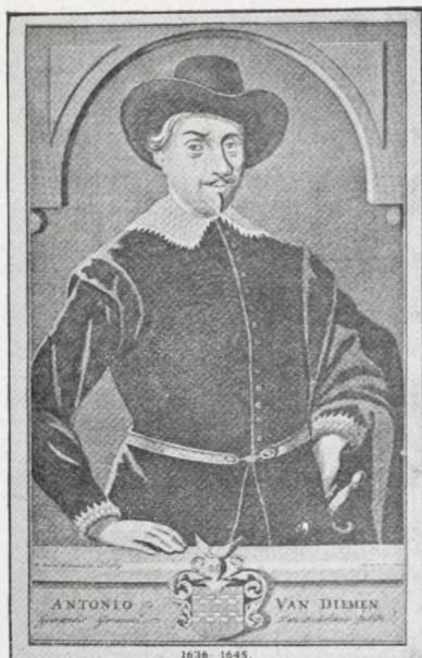
Antonio van Diemen