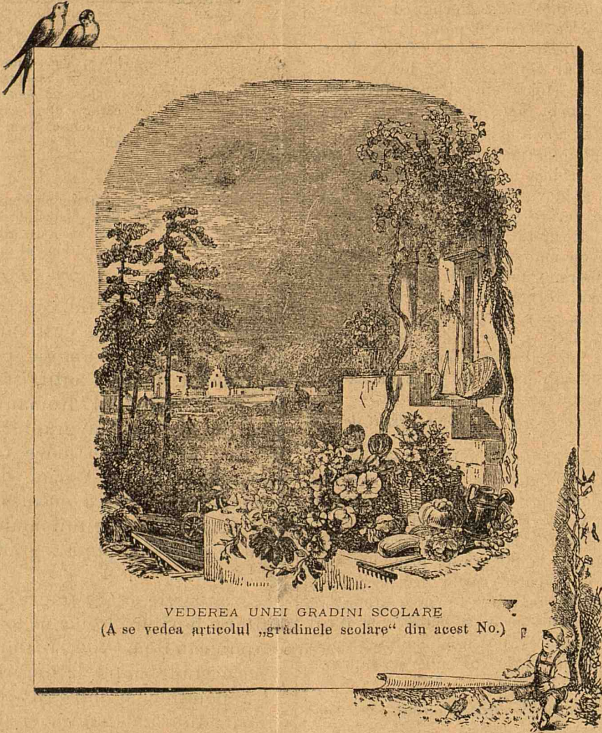
VEDEREA UNEI GRADINI ȘCOLARE (A se vedea articolul „grădinele școlare“ din acest No.)

„Ași voi, dice un mare pedagog, ca copilul meu să fe foarte simțitor la mirósele plăcute ale florilor, precum este trandafirul, viorica, crinul, verbina, rozeta, rosmarinul, iasomia și busuiocul; și cređ că este bine să'l