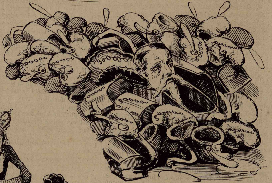
Marea molie care au rosu budgetul și efectile armatei!

Astă lumina ne sdrobesce cum să o eclipsăm, până nu ne om da ortul popii?