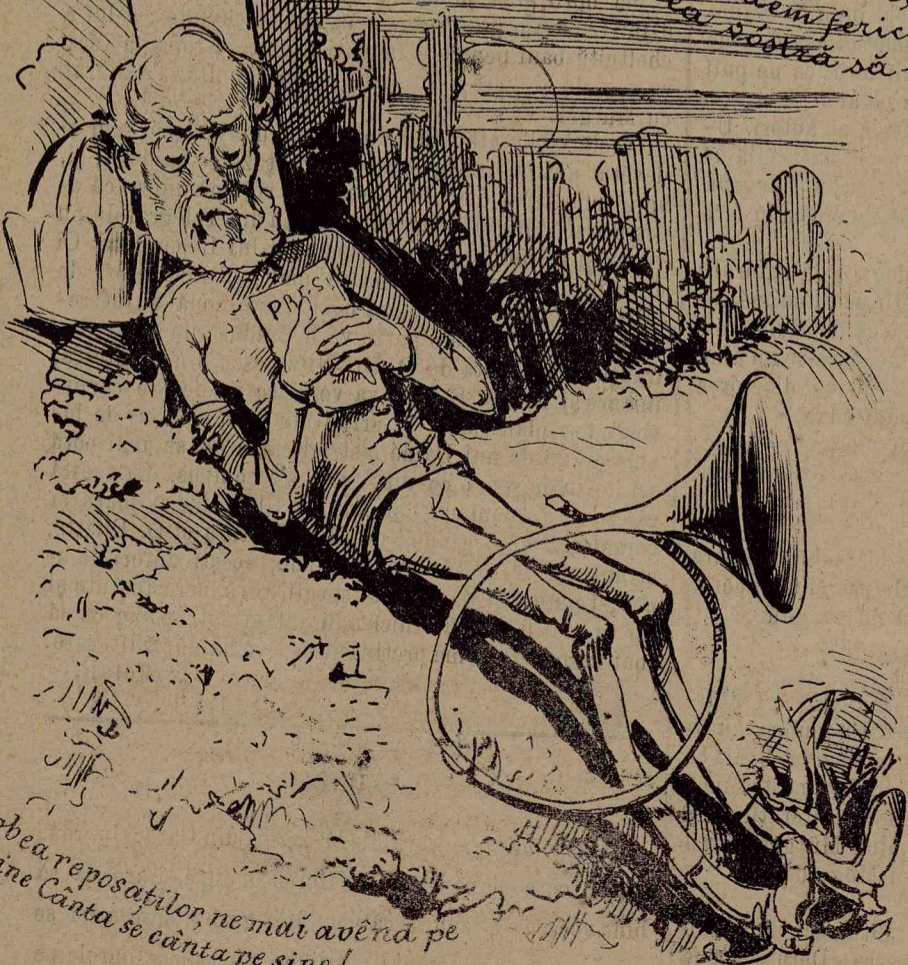
Cobea reposaților, ne mai având pe cine cânta se cânta pe sine!