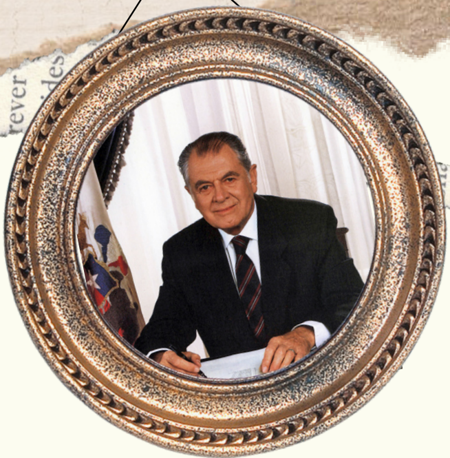
Ex-Presidente Patricio Aylwin (1990-1994)

“Sin una economía próspera, resultará vana la más avanzada legislación social.”