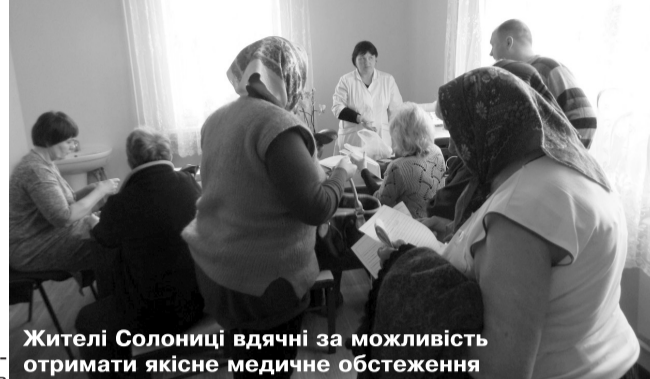
Жителі Солониці вдячні за можливість отримати якісне медичне обстеження

Він зазначає, що при розрахунку коштів на сімейного лікаря необхідно вводити коефіцієнт сільського населення.