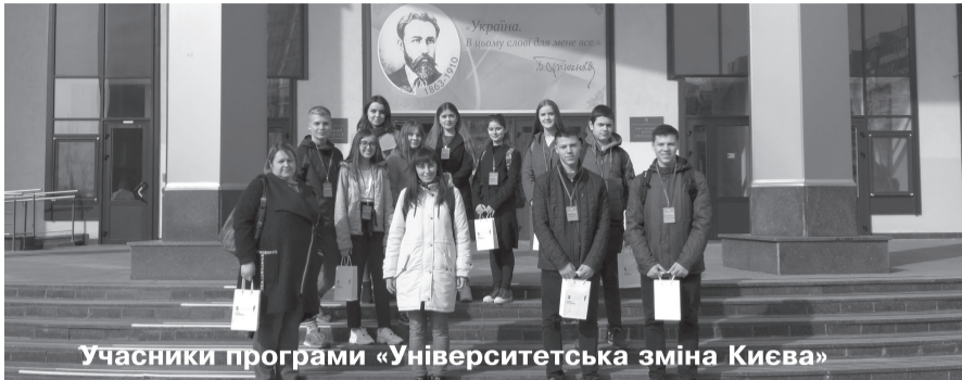
Учасники програми «Університетська зміна Києва»

Минулого тижня школярі Козельщинського району відвідали провідні університети столиці. Таку можливість вони отримали завдяки ініціативі благодійної організації Миколи Сушка Smart Foundation.