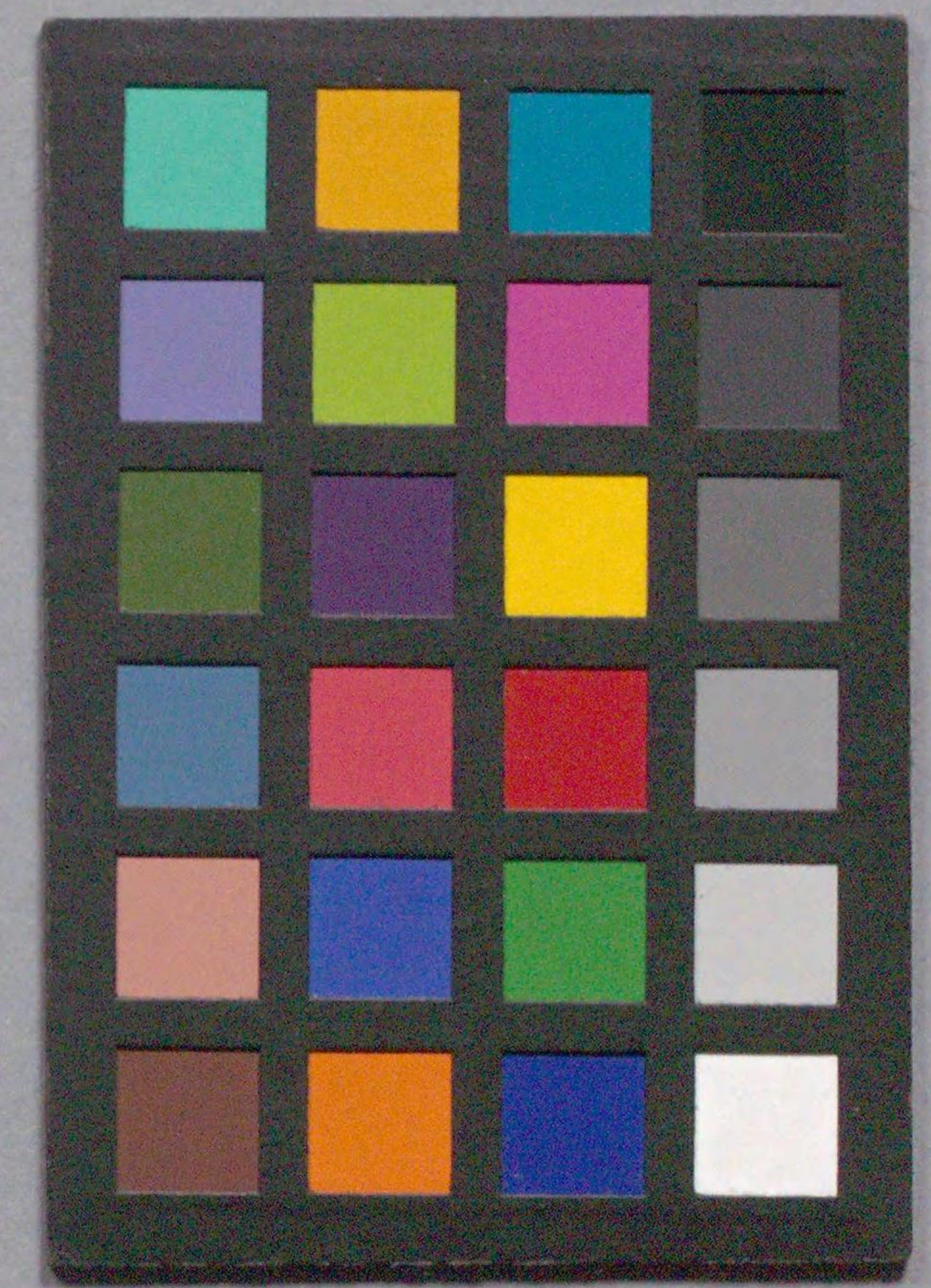
国立国会図書館 衆芳軒書籍目録 W465-N5