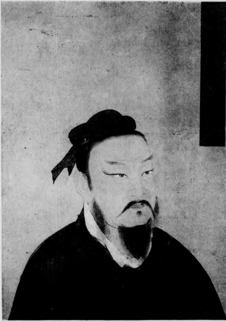
商 瞿 像 (一之像賢先聖至殿肅南)