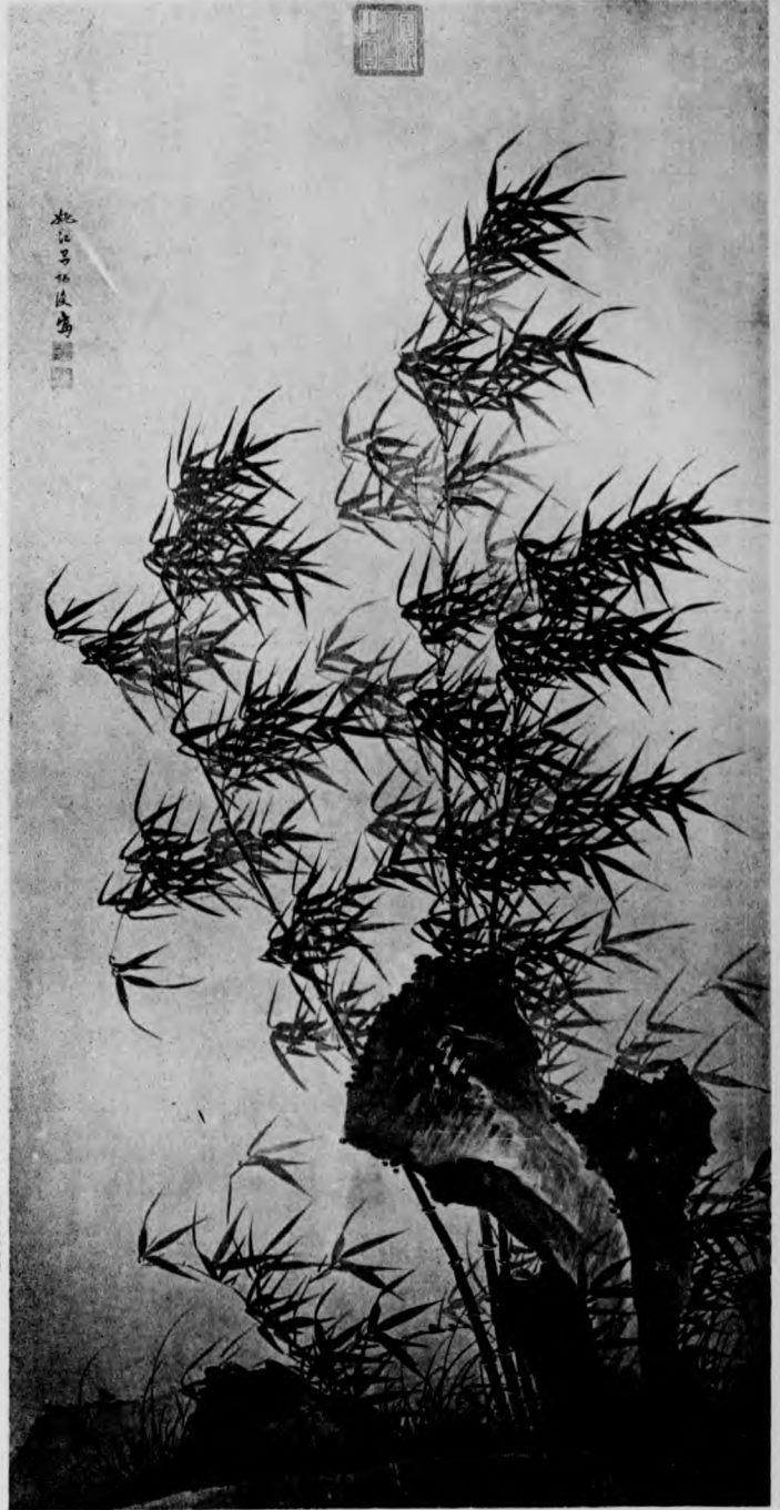
「宮殿後車頭、諸史會要、明畫錄均未詳、惟云善畫竹、或云尤善墨竹、顧款為「塘江居氏」一語、塘江或即其鄉里也、但塘江縣志又付闕如、俟來日覓得、再為補述、」