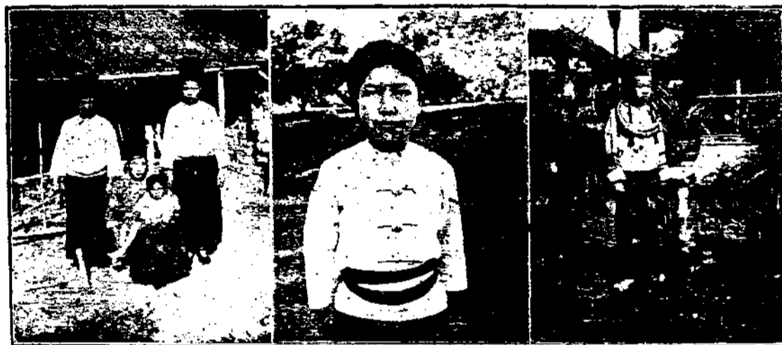
邁放土司屬境中之 勐夷少婦