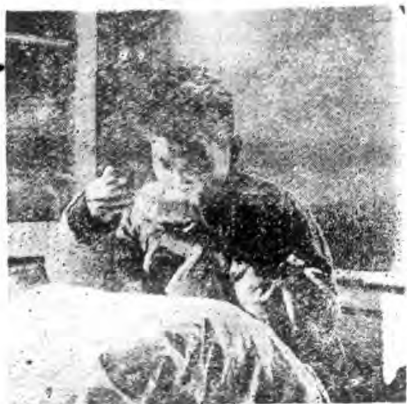
彈穿胸 部健飯 猶昔的 戰士 王立清