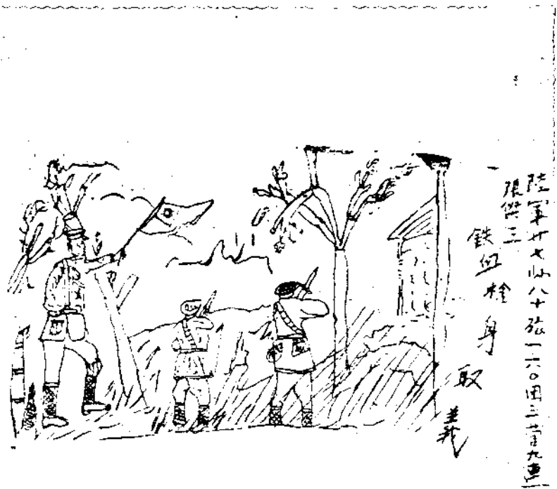
！放 再 人 敵 了 準 描