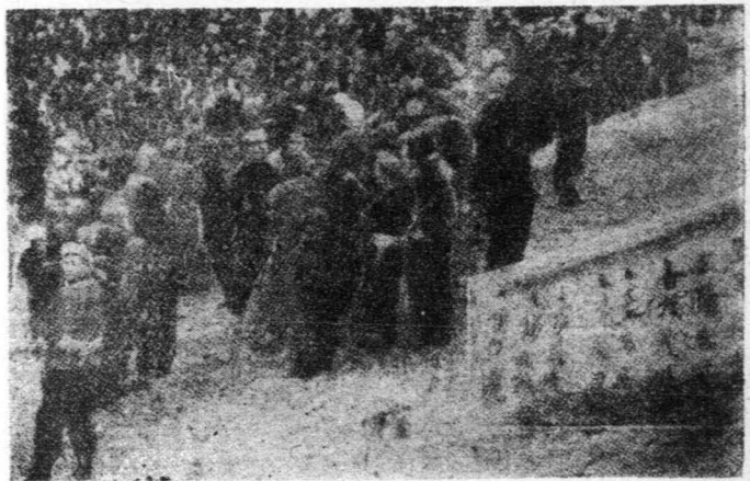
會大日抗衆羣安延·州·五·七三九一