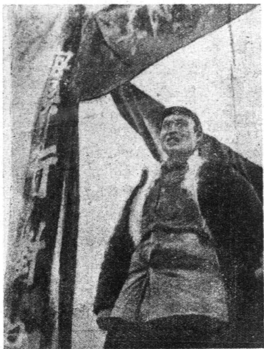
朱德將軍在抗日大會上向羣衆講演