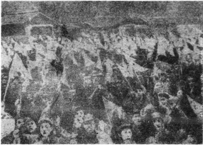
日抗致一國全求要會大合聯民軍北陝